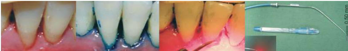
Figura 4. Imagen tomada de Betsy, J., Prasanth, C., Baiju, K., Prasanthila, J. and Subhash, N. Efficacy of antimicrobial photodynamic therapy in the management of chronic periodontitis: a randomized controlled clinical trial. J Clin Periodontol. 2004; 41(6):573-581.

Exactamente igual que el desbridamiento radicular convencional elimina el biofilm y cálculo (placa bacteriana) de la superficie dura del diente, la descontaminación con láser elimina el biofilm dentro del tejido necrótico de la pared de la bolsa. La energía del láser en conjunto con el agente fotosensibilizador interactúa fuertemente con el tejido inflamado, para ello esta energía se administra en la zona diana mediante unos sistemas de transmisión de fibra óptica cuya punta se introduce unos milímetros en la pared del tejido dañado (fig. 4). 14