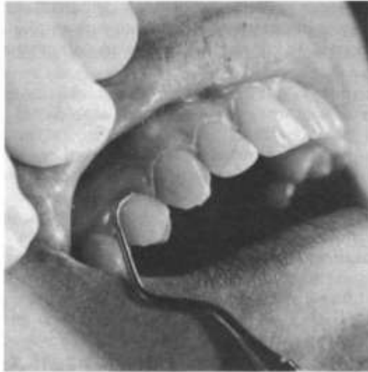
Figura 2. Imagen tomada de Carranza F., Take H. and Newman, M. Periodontología clínica. 9ª ed. México: McGraw-Hill Interamericana ;2004.

El raspado y alisado radicular (fig. 2), que es la técnica convencional por excelencia en el tratamiento de la periodontitis, consiste en una remoción instrumental de los depósitos acumulados sobre la superficie dental tanto a nivel supragingival como subgingival, de tal manera que disminuye la concentración bacteriana disminuyendo a su vez las principales especies periodontopatógenas. 10 Sin embargo, aunque se mejoren los parámetros clínicos, estudios como el de Brayer y cols. 1989 11 demostraron que esta técnica presenta limitaciones debido a factores como la anatomía radicular, la profundidad de la bolsa o la inadecuada técnica seguida por el profesional que hacen que la completa eliminación de los depósitos sea difícil. Ante esto se han buscado métodos complementarios del raspado y alisado radicular que ayuden a eliminar los patógenos. Uno de estos métodos es el uso de antibióticos sistémicos 12 , pero presentan inconvenientes como el desarrollo de resistencia a los antimicrobianos, lo que ha desembocado en la búsqueda de nuevas terapias complementarias como la terapia fotodinámica. 13