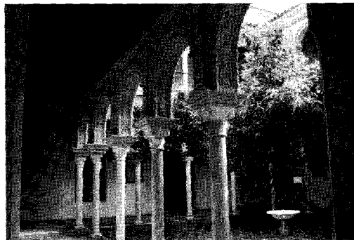
Figura 4 Patio de la casa de los Pinelo

Siguiendo un proceso general, semejante al resto de la arquitectura española del siglo XVI, que evoluciona desde un barroquismo decorativo hasta la ausencia ornamental, las arquerías de los patios sevillanos de fines de ese siglo carecen de motivos decorativos. Ese es el caso, por ejemplo, del de la Real Audiencia, construido entre 1595-97. Si el orden preferente en la primera mitad de siglo es el co-