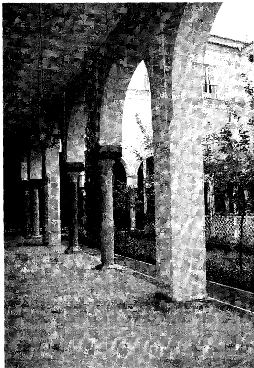
Figura 3 Soportes del patio del palacio de Altamira

primer tercio del siglo XVI suelen ser angrelados. Están ricamente decorados con yeserías, a base de festones y decoración floral (figura 4). De diferente tipo, más primitivo, es el modelo de arco que sirve de acceso a las capillas de Pilatos y las Dueñas. Es conopial, enriquecido de crochets, con adornos de tracería gótica en las enjutas. Sobre su dintel hay un friso con tres pequeñas ventanas lobuladas y caladas, del tipo del palacio mudéjar de Pedro I. Enmarca el conjunto un ancho alfiz ricamente decorado con atauriques.