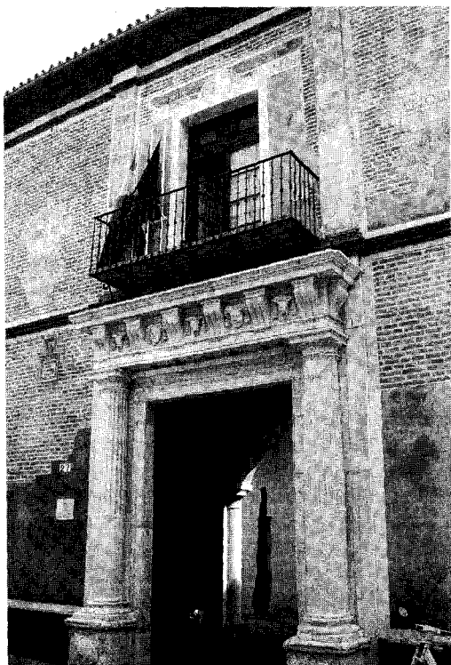
Figura 2 Fachada y portada principal de la casa de Miguel de Mañara

para formar los mechinales. Las dos tiras superiores del tapial suelen presentar la anomalía de que la separación entre cajones es de cal, en gruesa lechada, y no de ladrillo, estando los mechinales formados por cuatro trozos de teja. Los muros exteriores de estas casas solían dejar visto el ladrillo agramilado. Otras veces se enlucía con cal o con almagra.