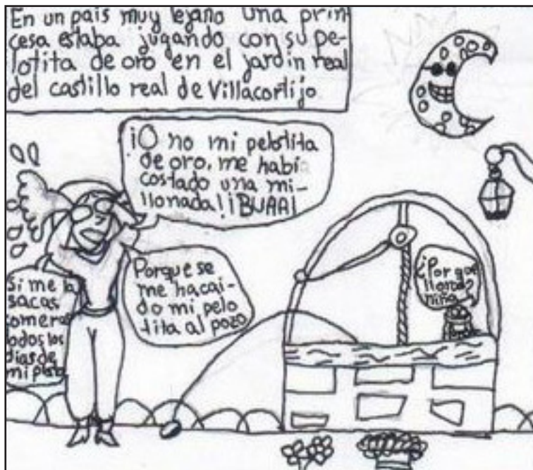
Figura 1. Los textos narrativos acrecientan la temporalidad. Elaboración propia.

de reconstrucción de la misma. A mayor abundancia de textos, más lento es el ritmo narrativo; mientras que con su escasez se propicia un mayor predominio de la dimensión icónica y la narración se hace más visual y, por lo tanto, más ágil.