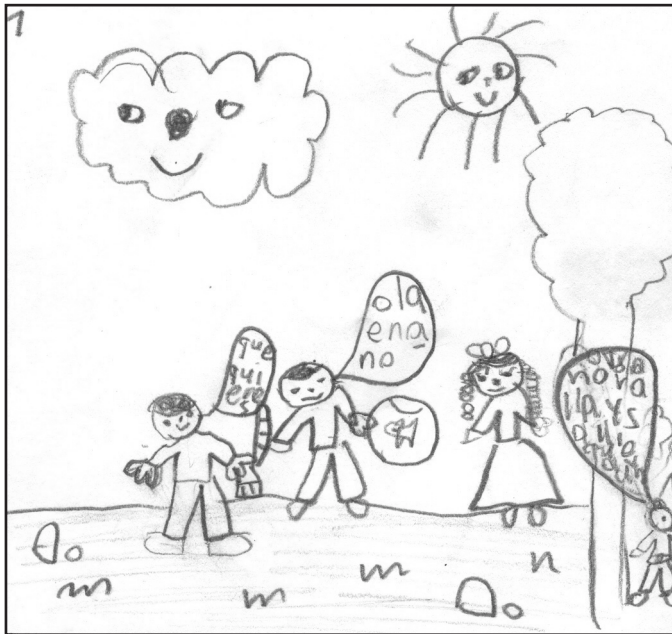
Figura 3. Viñeta realizada en 2º curso.

narrativas que el niño adquiere a lo largo de la infancia, y es de crucial importancia atender al correcto desarrollo de estas tres capacidades en el ámbito de la educación formal.