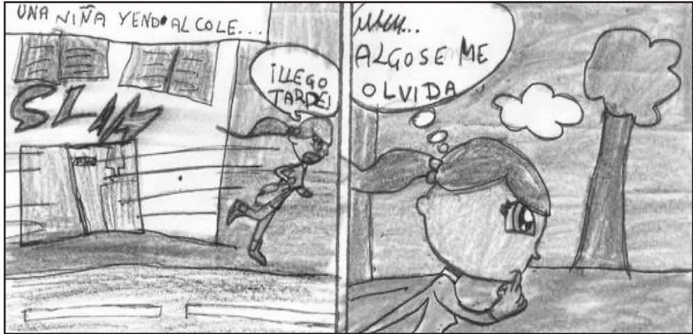
Figura 2. Construcción del espacio y utilización de diversas escalas en el encuadre. Elaboración propia.

Ello deriva en una mayor potencialidad creativa en el lenguaje gráfico. Incluso, la libertad de ejecución de la que dispone el dibujante, le permite crear, en un solo espacio fraccionado, varios escenarios que ocupan una sola página.