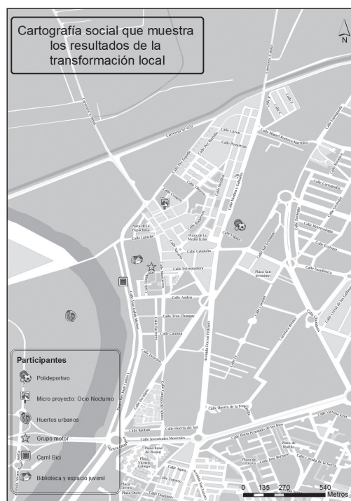
Figura 3: Cartografía social de los recursos existente en el barrio de San Jerónimo, Sevilla, fruto del proceso de transformación local con los vecinos incluidos los/as jóvenes.

A continuación presentamos en la Figura 3 una cartografía participativa realizada por todos/as las participantes que muestra el barrio con los cambios conseguidos después de la experiencia de participación de la que formaron parte.