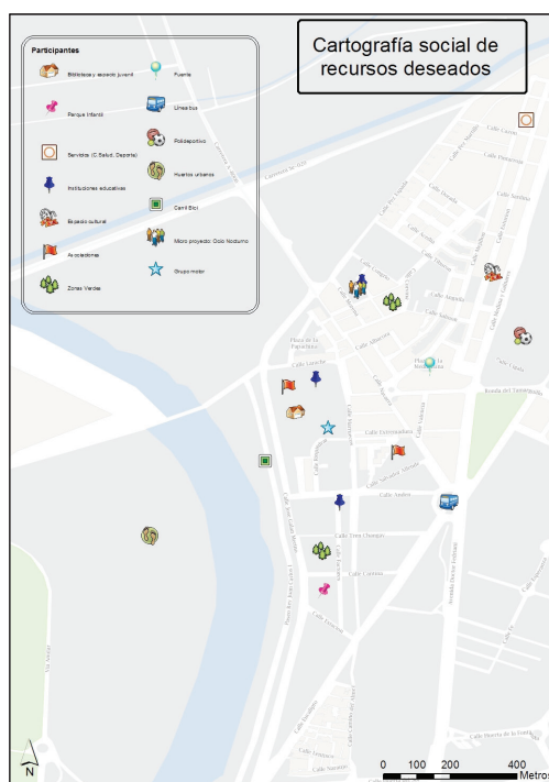
Figura 1: Cartografía social de los recursos existente en el barrio de San Jerónimo, Sevilla.

El análisis del barrio a partir de la cartografía social desvela aspectos desconocidos al emplear prácticas, propuestas y acciones desde fuentes y recursos de quienes lo habitan. Pero, sobre todo, permite construir otros territorios frente a las versiones oficiales. Por ello, las personas narran el territorio a partir de sus propias experiencias, creencias que construyen pensamiento y prácticas para fortalecer procesos de transformación. Los jóvenes que participan en la investigación se detienen a reconocer el contexto y a valorarlo a partir de lo biológico y de lo social. A continuación, presentamos en la Figura 1 una cartografía realizada por una participante donde quedan recogidos los recursos del barrio: