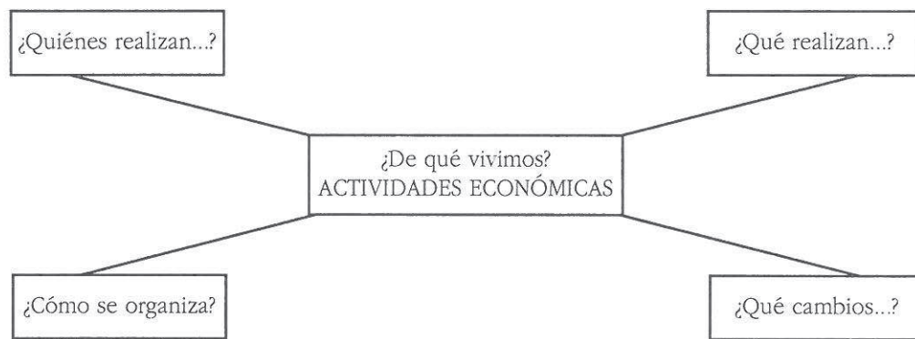
Gráfico. 1. Trama básica de problemas de la unidad

1) ¿Quiénes realizan las actividades económicas? Los conceptos organizadores que podremos considerar aquí serían “elementos” y “diversidad”, con lo que las cuestiones podrían ser del tipo: ¿Quiénes trabajan? ¿Qué profesiones existen? ¿Quiénes están en paro? ¿Qué son las empresas? ¿Qué tipo de empresas hay?