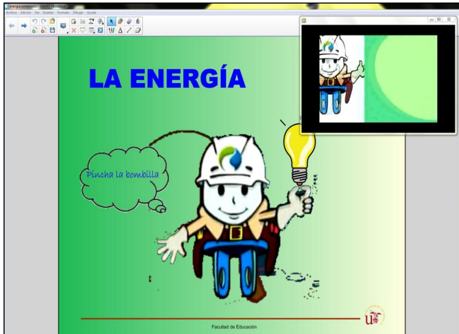
Figura 2. Ejemplo de Portada del material

En la figura 2 se muestra la portada del tema de la energía y se puede ver como ejemplo de que todas las portadas incluían un enlace a un vídeo introductorio al tema, cuya duración no excedía los 10 minutos.