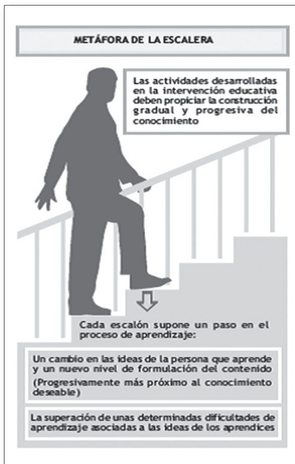
Fig. 1. García, Rodríguez-Marín y Solís (2008: 25).