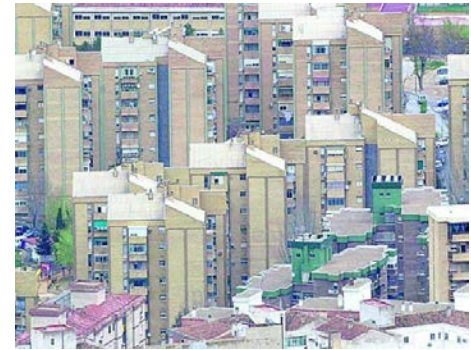
Figura 2. Vista del tipo de construcción del barrio.

Se percibe por tanto un ambiente familiar, en el que la mayoría de la gente se conoce y está dispuesta a ayudar al vecino, de ahí la importancia de la solidaridad y peso del movimiento vecinal en el barrio; movimiento motivado por las actuaciones a todos los niveles