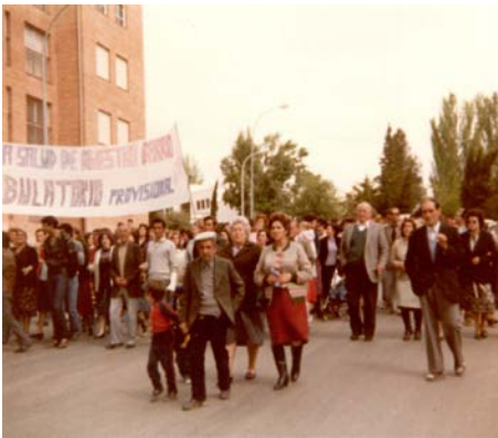
Figura 4. Concentración por la construcción de un ambulatorio en el barrio. Años 80.

Por la naturaleza del barrio de El Polígono del Valle, desde su nacimiento hasta nuestros días, el aspecto reivindicativo y vecinal ha sido muy importante en la historia y evolución del barrio; en un principio las reivindicaciones eran de tipo urbanístico por la adecuación de los espacios e inexistencia de centros sanitarios o educativos, para posteriormente, dar lugar a reivindicaciones de tipo social.