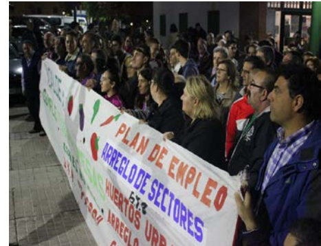
Figura 5. Concentración por la mejora urbanística del barrio y creación de huertos urbanos. Año 2014.

Por otro lado, en lo que a la creación de cursos para fomentar la empleabilidad se refiere, este año se ha hecho llegar un escrito al Ayuntamiento, entidad convocante de los mismos, para que los criterios de selección y puntos para acceder a los cursos fueran de carácter público y se conocieran antes de la realización de los