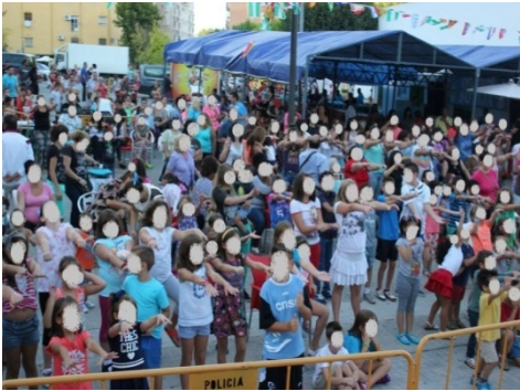
Figura 3. Convivencia vecinal durante las fiestas del barrio.

que llevan a cabo tanto la Asociación de vecinos como la Parroquia y Servicios Sociales, con la finalidad de mejorar las condiciones de vida e igualdad de todos los habitantes de la zona; así, encontramos diversas actuaciones que concretaremos más adelante.