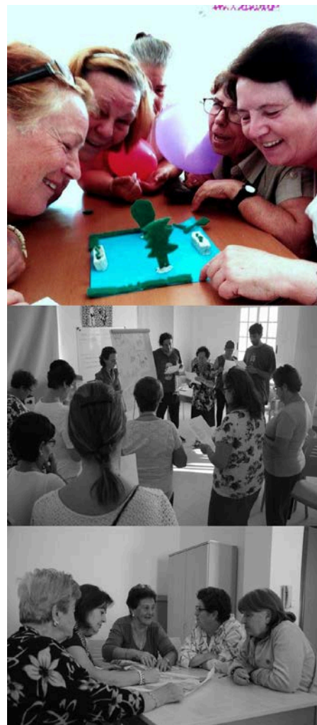
Figura 9. Imágenes de las sesiones de Capacitación y Empoderamiento del Adulto mayor, incluidas en el Proyecto Ciudades Sostenibles.

Metodología y programa: Con esta actividad se pretendió compartir con nuestros ciudadanos más experimentados los conceptos y herramientas para que, haciendo uso de su propia ciudad y de ejemplos urbanos próximos, pudieran transformarse en agentes para el cambio social y para el desarrollo sostenible. Para lograr tan