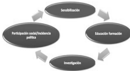
Figura 4. Dimensiones de la Educación para el Desarrollo.

actividades de empoderamiento y sensibilización destinadas por un lado a la capacitación de todos los ciudadanos sobre las distintas cuestiones teórico-prácticas que encierra el ambiente en el que habitamos otorgándoles unos conocimientos básicos y aumentando así el nivel de la calidad de los resultados de dicha participación, y por otro, a la inclusión en dichas actividades de mecanismos educativos-formativos, que permitan concienciar a todos los habitantes de lo realmente importante de su vinculación a dichos procesos, consiguiendo así una implicación personal de los habitantes en los procesos de cambio que sufren los lugares donde habitan.