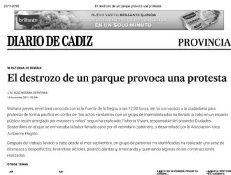
Figura 8. Noticia del Diario de Cádiz del día 11 de Nov de 2016 que recoge las protestas pacíficas en defensa del espacio regenerado.

implicación real y personal de cada uno de los asistentes en la mejora de un área elegida por ellxs mismxs y sobre el que hayan decidido y planificado previamente, usando todos los nuevos conocimientos adquiridos durante el proceso, como podría mejorarse y usando que medios.