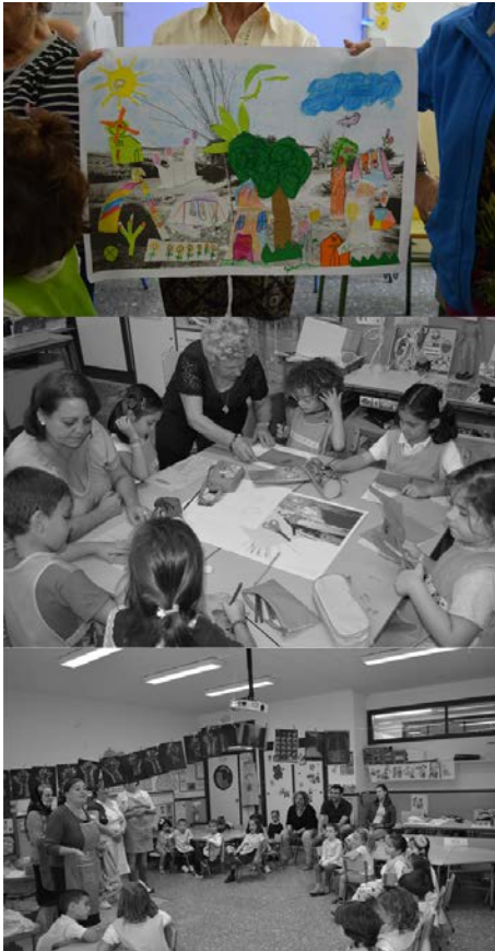
Figura 10. Imágenes de las sesiones Intergeneracional de Capacitación y Empoderamiento en el grupo infantil, incluidas en el Proyecto Ciudades Sostenibles.

importante reto, el programa estuvo compuesto por dos fases formativas y una fase práctica y participativa.