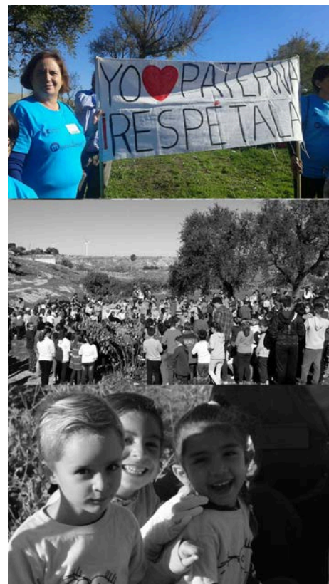
Figura 11. Imágenes de las sesiones de Acción urbana y posteriores manifestaciones.