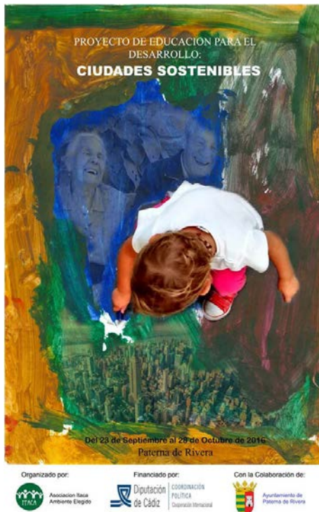
Figura 1. Cartel del proyecto ciudades sostenibles. Fuente Asociación Itaca Ambiente elegido