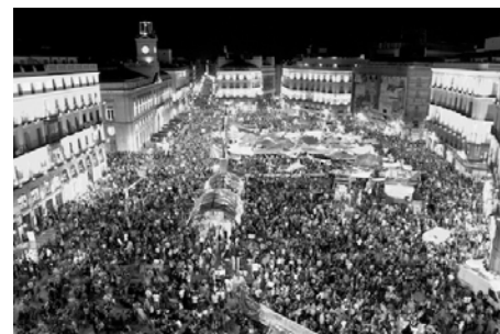
Figura 3. Manifestaciones en la puerta del Sol. Movimiento 15 M. 2011.