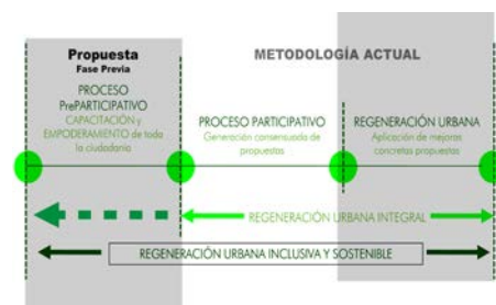
Figura 7. Diagrama explicativo del concepto de Pre-Participación.

Un proceso, que como adelantábamos al principio tendrá un enfoque socio-afectivo vivencial para lo cual es fundamental la realización de una última fase activa de propuesta y mejora real de una situación degradada. En otras palabras, después de un proceso teórico se buscará por medio de la realización de una ACCION URBANA la