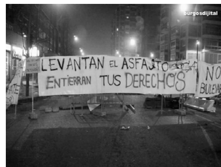
Figura 2. Pancarta en las protestas ciudadanas del Barrio del Gamonal en burgos.

Desde la asociación Ítaca Ambiente Elegido, y a partir del entusiasmo y los conocimientos de una serie de técnicos y profesionales de ámbitos tan diversos como la arquitectura, el urbanismo, la biología y las ciencias ambientales o la cooperación y la educación para el desarrollo, hace ya varios años que estamos proponiendo y poniendo en práctica, tanto en Europa como en América toda una serie de