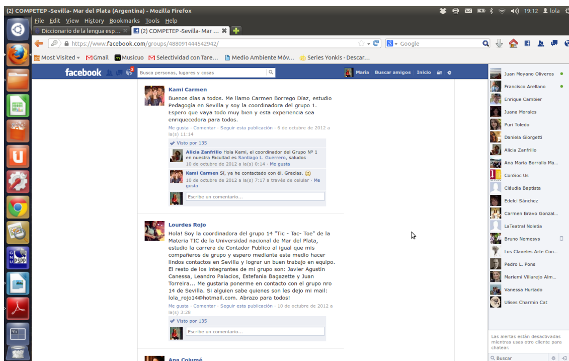
Cuadro nº1. Presentaciones de los diferentes grupos

El primer intercambio de información fue sobre el contexto universitario y las características de las disciplinas que iban a participar en la experiencia. En este sentido, el profesorado nos intercambiamos los proyectos. Se diseñó un grupo en Facebook denominado COMPETEP de carácter privado. Nuestra distribución (peer o peer) tenía la siguiente configuración trece grupos de trabajo con sus homónimos. Trece grupos secretos compuesto por los siguientes roles organizativos: coordinador, analista y documentalista.