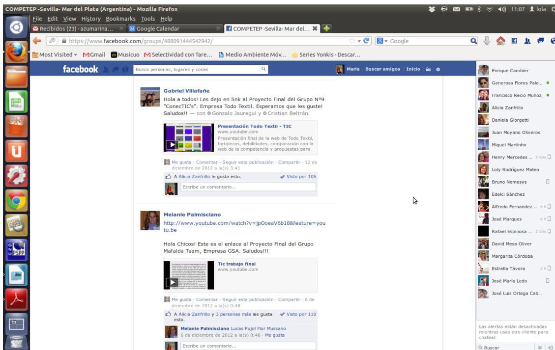
Cuadro n°3 Trabajos finales.

tuvo que preparar una presentación oral y presentarlo en la clase con la información recopilada. El proyecto comenzó cuando el grupo ya había tenido información suficiente a través de las sesiones formativas que se realizaban los jueves a primera hora de la mañana y su posterior sesión de prácticas de 120 minutos de duración que tenían lugar los viernes. Una vez estamos familiarizados con el entorno digital y hemos tenido contacto informal con nuestros compañeros al otro lado del Atlántico los estudiantes tuvieron cuatro semanas para discutir en Facebook y completar su presentación de diapositivas.