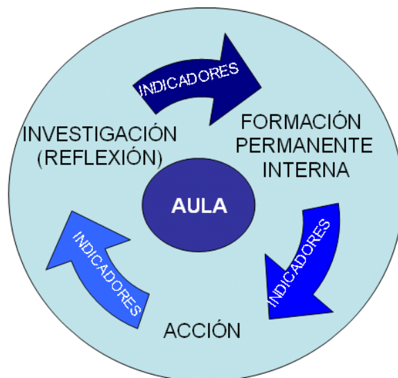
Figura 1. Modelo de Formación Permanente interna, utilizando indicadores.

situaciones educativas. Entendiendo que debería de aplicarse a todas las fases del proceso de enseñanza-aprendizaje.