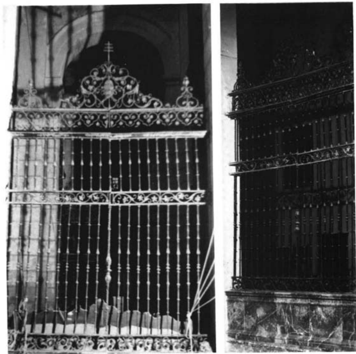
2. Reja lateral de la Capilla Mayor del templo de San Miguel de Morón de la Frontera, obra de Juan de los Ríos Vallejo.