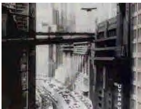
Fotogramas de Metrópolis (Fritz Lang, 1925).

Juan Ibarrondo, “Retazos de la red” (novela de política-ficción)