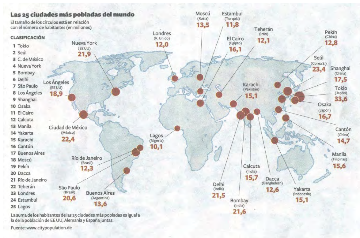
Figura 2. Las 25 ciudades más pobladas del mundo. http://www.citypopulation.de .

Pero también se dan otras importantes diferencias entre los territorios del Centro y de la Periferia del nuevo capitalismo global. En los espacios centrales en torno a las 4/5 partes de su población habita en áreas urbanas, teniendo una muy baja población empleada agraria (menos del 3% en EEUU, algo superior al 5% en la UE, y algo similar acontece en Japón). Además, como ya hemos apuntado, la agricultura que se da en estos espacios centrales es casi en su totalidad una agricultura sin campesinos, altamente industrializada, que utiliza una mano de obra inmigrante, en muchos casos clandestina o “ilegal”, en condiciones de hiperexplotación y semiesclavitud. En los espacios periféricos sin embargo la situación es enormemente diversa. Así, tenemos desde Estados agroexportadores como Argentina o Brasil con porcentajes de población urbana parecidos a los espacios centrales, en torno a un 80% del total, con gran presencia del agrobusiness, a