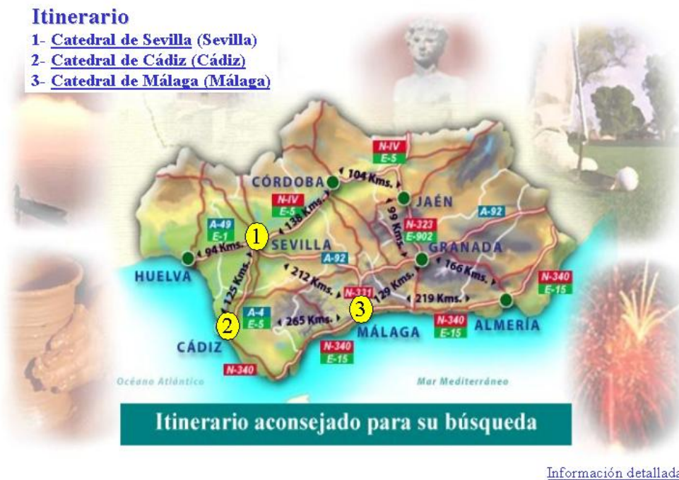
Fig. 3. Pantalla de resultados de búsqueda

De manera abstracta, y partiendo de que el usuario ya ha introducido los datos en el sistema, los pasos que debe realizar el proceso de generación de itinerarios culturales son los siguientes: