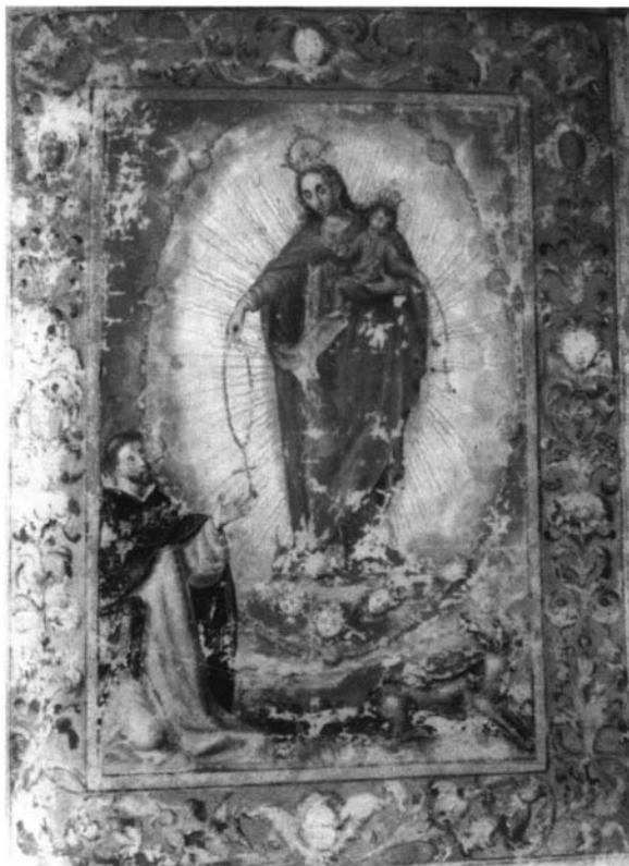
9.- La Virgen entregándole el rosario a Santo Domingo. Regla de la cofradía de la Virgen del Rosario, folio 13.