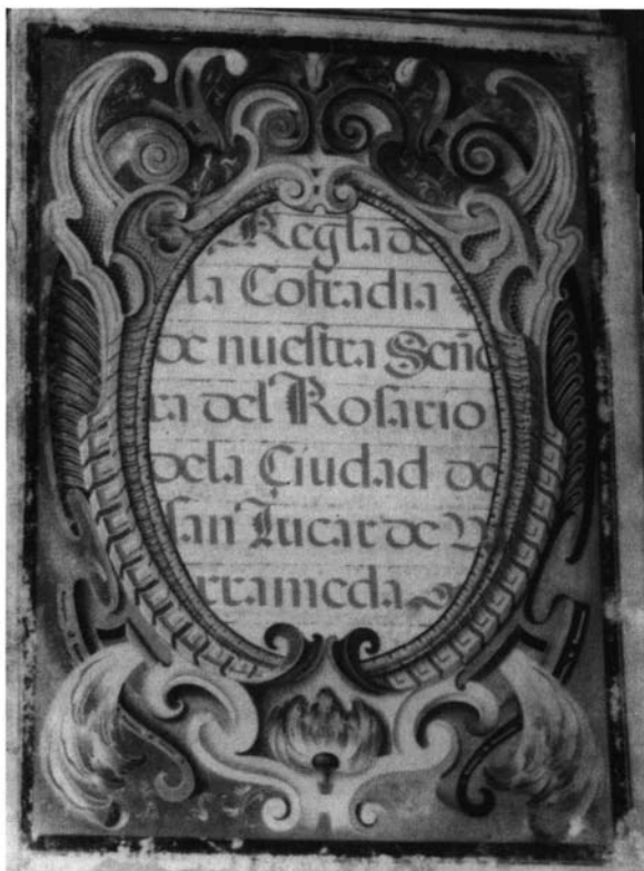
7.- Regla de la cofradía de la Virgen del Rosario, folio 1.