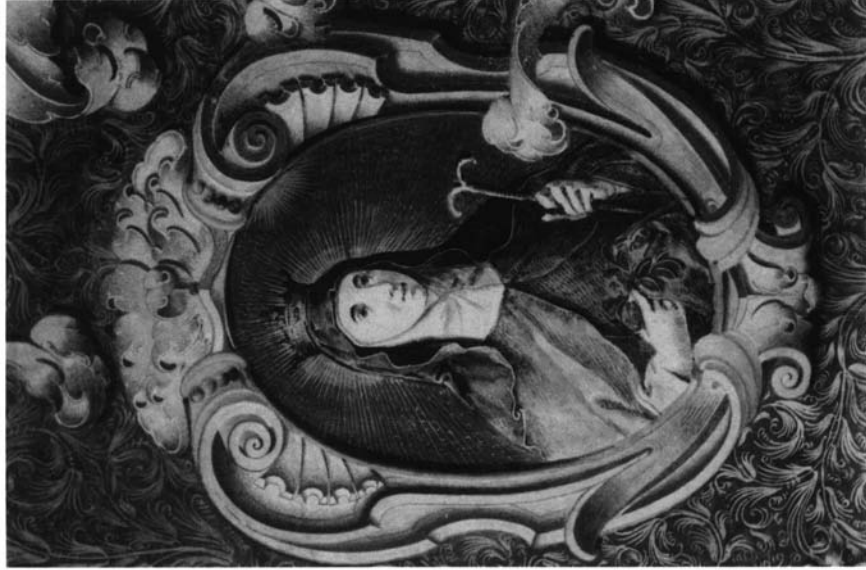
5.- Santa Isabel de Portugal. Libro de coro 21 de la Catedral de Sevilla, folio 0 vuelto.