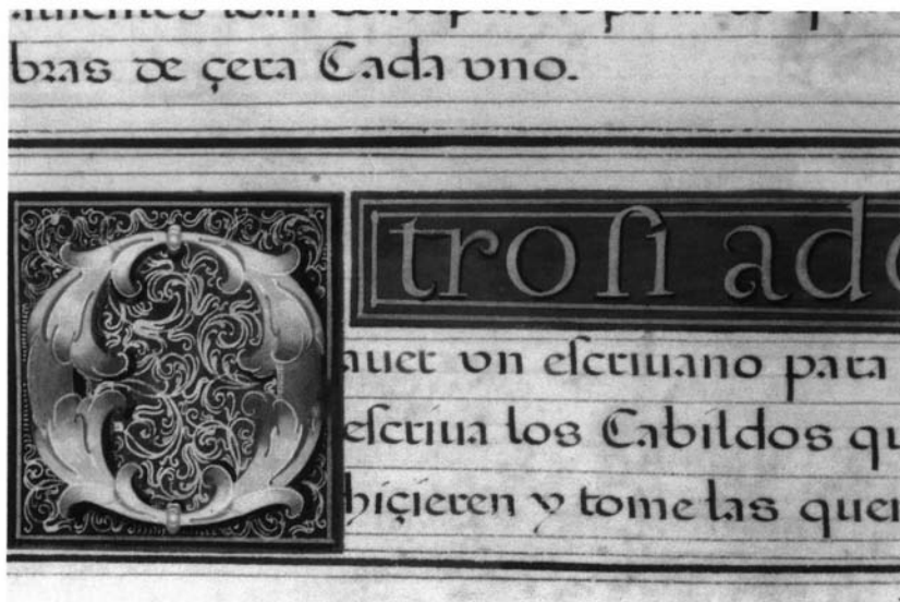
4.- Regla de la cofradía de la Virgen del Rosario, folio 6 vuelto.