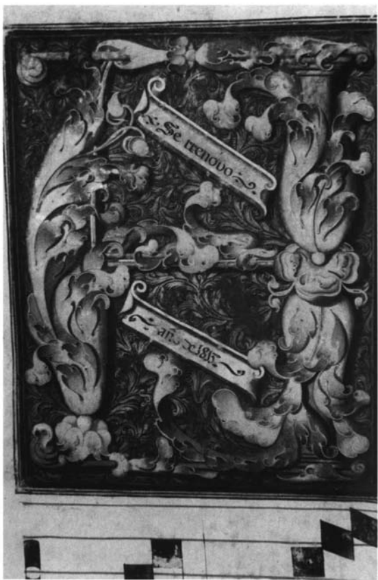
1.- Letra miniada del libro de coro 103 de la Catedral de Sevilla, página 1. Las cartelas han sido borradas y vueltas a escribir con la fecha de la restauración del libro.