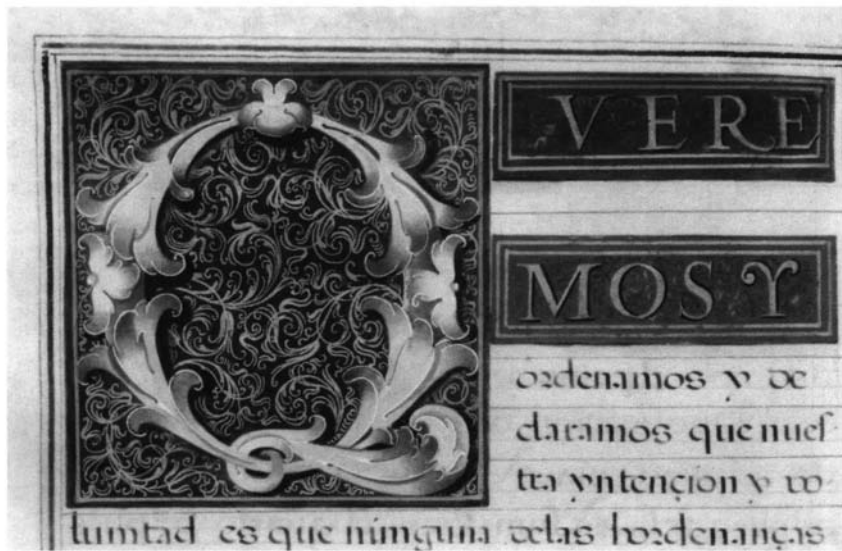
3.- Regla de la cofradía de la Virgen del Rosario de Sanlúcar de Barrameda, folio 5 vuelto.