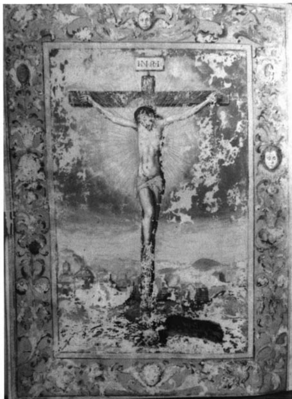
8.- Calvario. Regla de la cofradía de la Virgen del Rosario, folio 12 vuelto.