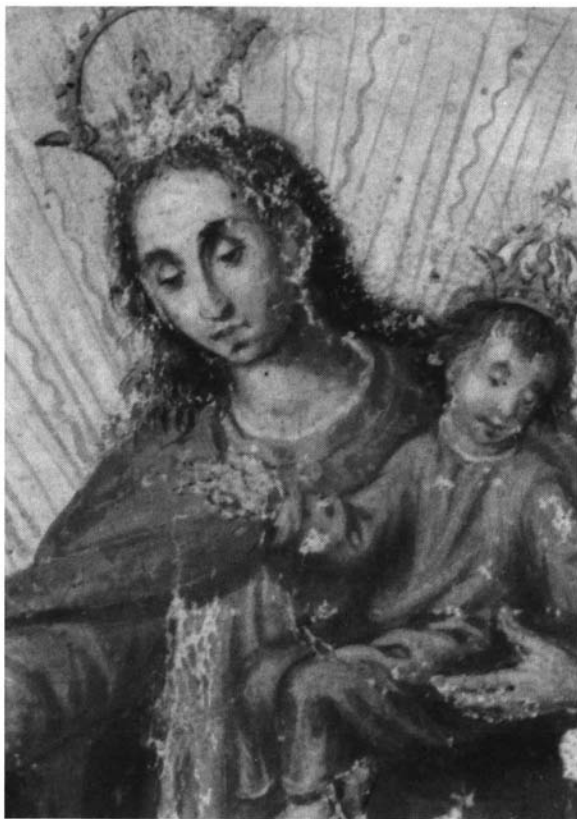
10.- Detalle de la Virgen. Regla de la cofradía de la Virgen del Rosario, folio 13.