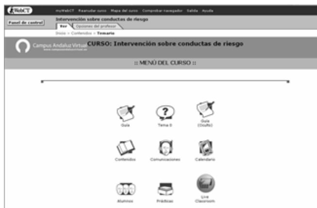
Figura nº 4: Menú del curso de la asignatura.

b) Nos sorprendió, gratamente, el alto aporte de materiales y recursos, de todo tipo (enlaces, textos, canciones, vídeos, etc.) realizado por el alumnado, este hecho ha enriquecido la