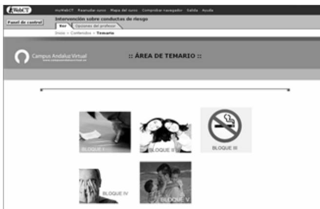
Figura nº 3: Página del área del temario de la asignatura.

La temática sobre la que vamos a trabajar es la prevención de la violencia en las relaciones de pareja de adolescentes y jóvenes. Para trabajar utilizaremos, de momento, dos archivos que os adjunto “Mitos sobre el maltrato de género” “La prevención de la violencia de género en adolescentes. Una experiencia en el ámbito