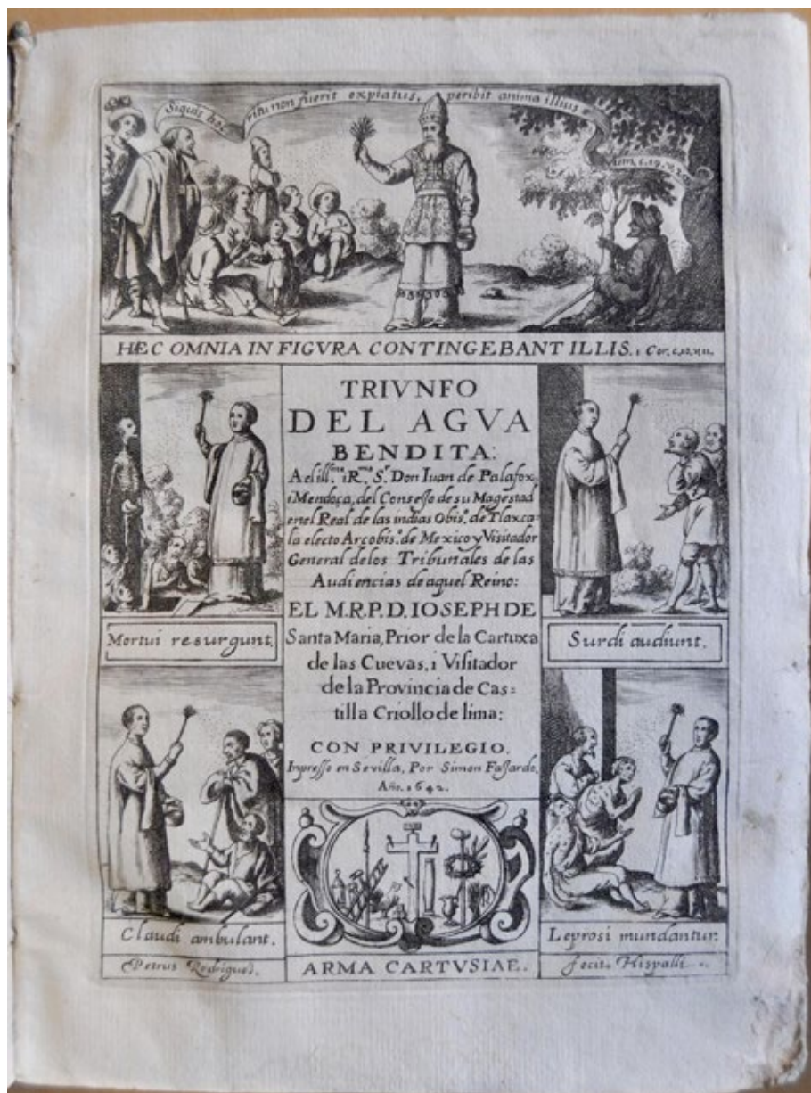
Figura 2. Portada de Triunfo del agua bendita... de José de Santa María, (O. Cart.). Impreso en Sevilla: por Simon Fajardo, 1642. Pedro Rodríguez, 1642. Biblioteca de la Universidad de Sevilla. A 091/015.