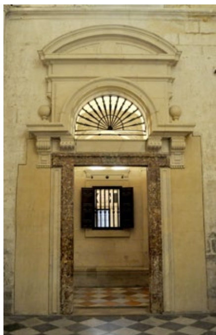
Figura 4. Portada del Antecabildo de la Catedral de Sevilla. Asensio de Maeda. 1587.