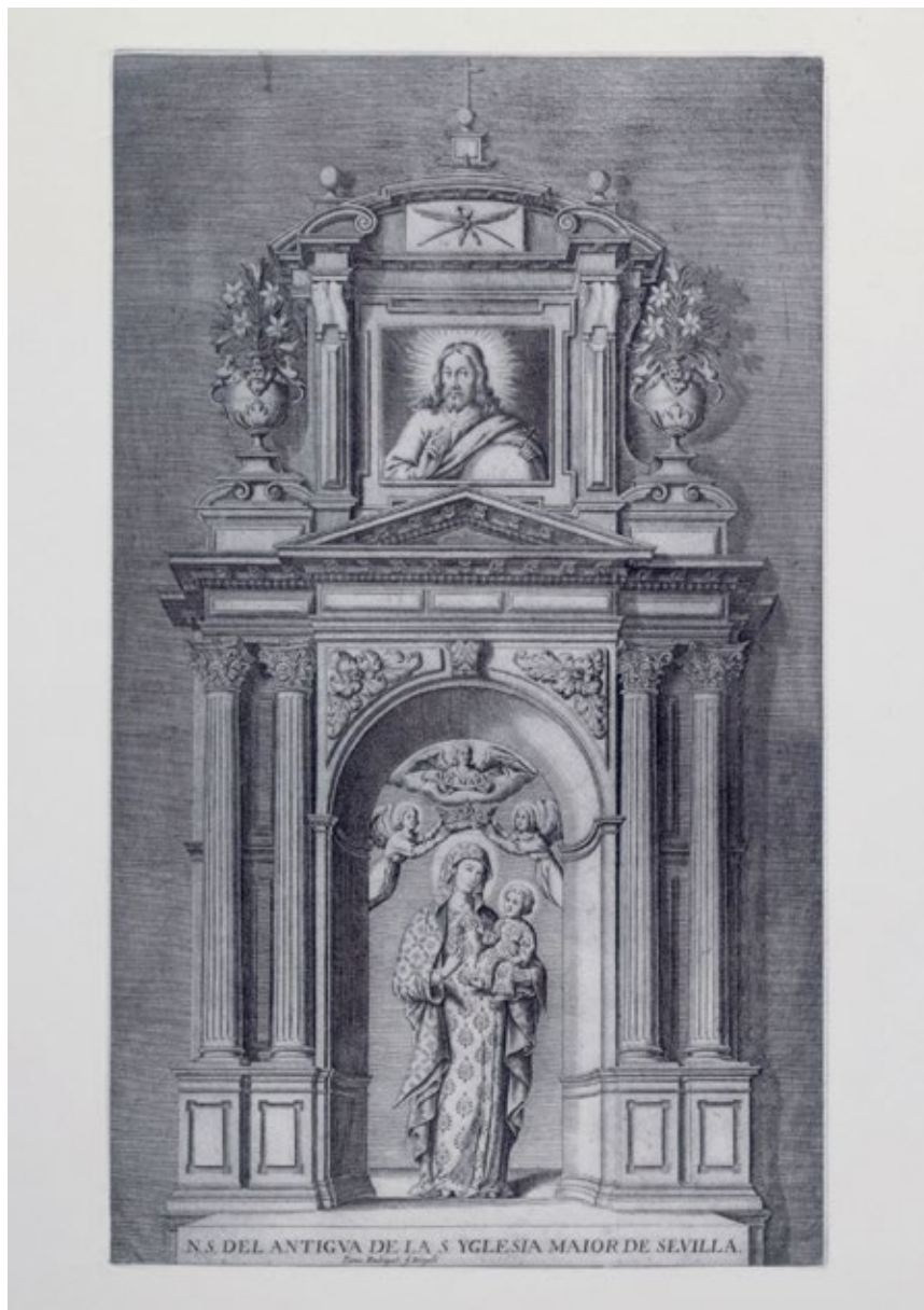
Figura 1. N. S. DEL ANTIGVA DE LA S. YGLESA MAIOR DE SEVILLA. R. 87. Pedro Rodríguez, mediados del siglo XVII. Gabinete de Estampas. Fundación Focus-Abengoa, Hospital de los Venerables, Sevilla.