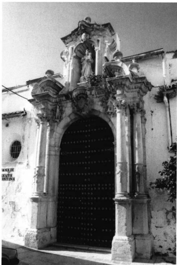
Portada lateral de la iglesia parroquial de San Sebastián. Estepa (Sevilla).