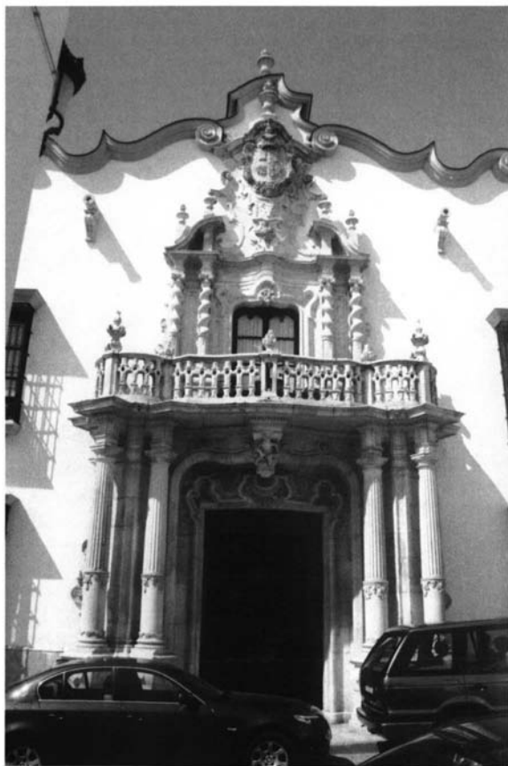
Portada del Palacio del Marqués de la Gomera. Osuna (Sevilla).