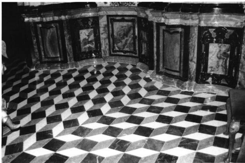
Zócalos y solería del camarín de la iglesia de Ntra. Sra. de los Remedios, Estepa (Sevilla).