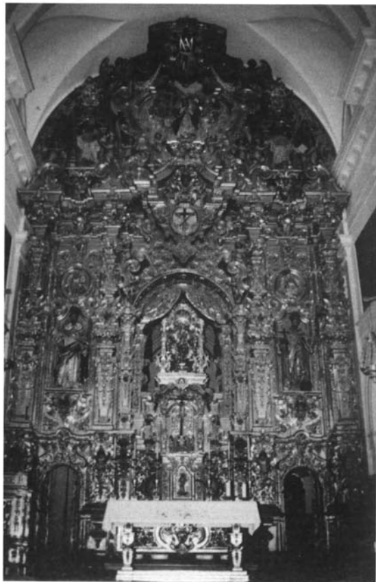
Fig. 3 Retablo mayor. Iglesia del convento de Ntra. Sra. de Loreto (Espartinas)