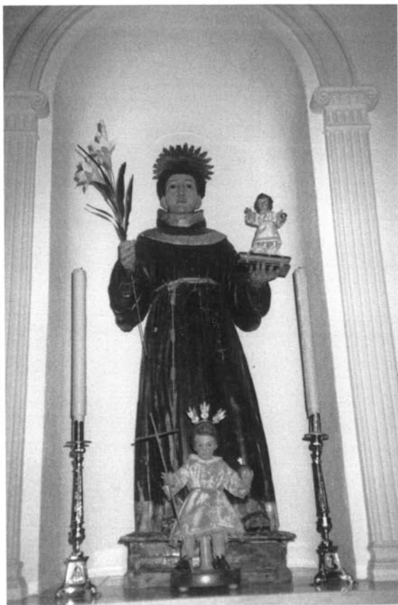
Fig. 4 San Antonio de Padua. Capilla de la Vera Cruz (Olivares)