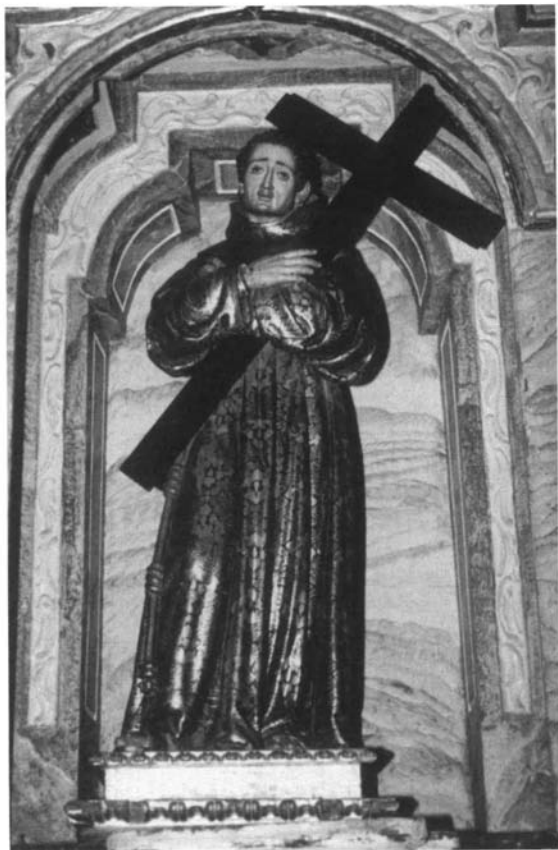
Fig. 2 San Diego de Alcalá. Iglesia del convento de Ntra. Sra. de Loreto (Espartinas)