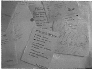
Fotografía n° 4

Después de realizar el recorrido se pidió que individualmente elaboraran un dibujo o una poesía tipo haiku en papel artesano que reflejara alguno de los sentimientos que le produjo dicho recorrido. Hay que señalar que 20 fueron los alumnos y alumnas que realizaron la composición escrita( foto n° 4 ), algunas de las cuales fueron muy interesantes ( figura n° 1 y 2 )