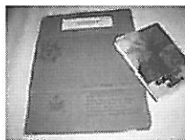
Fotografía nº 1