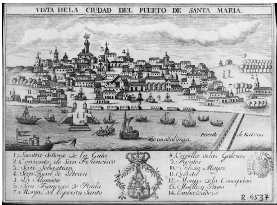
Figura 2. “Vista de la Ciudad del Puerto de Santa María”. B.N.M. Signatura Mv/14/Puerto de Santa María (Cádiz). Vistas de Ciudades.