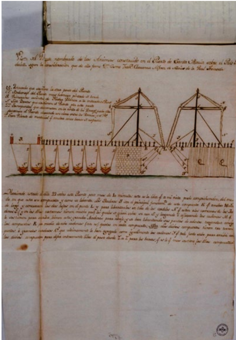
Figura 4. “Vista del Puente nombrado de las animas construido en el Puerto de Santa Maria sobre el Rio Guadalete segun la consideracion que de ella formo Dn. Cosme Franc. Carranza Alferes de Navio de la Real Armada”. A.H.M.S. Sección XI. Papeles del Conde del Águila. Tomo 36. Expediente nº 23. Fol.: 185 rº.