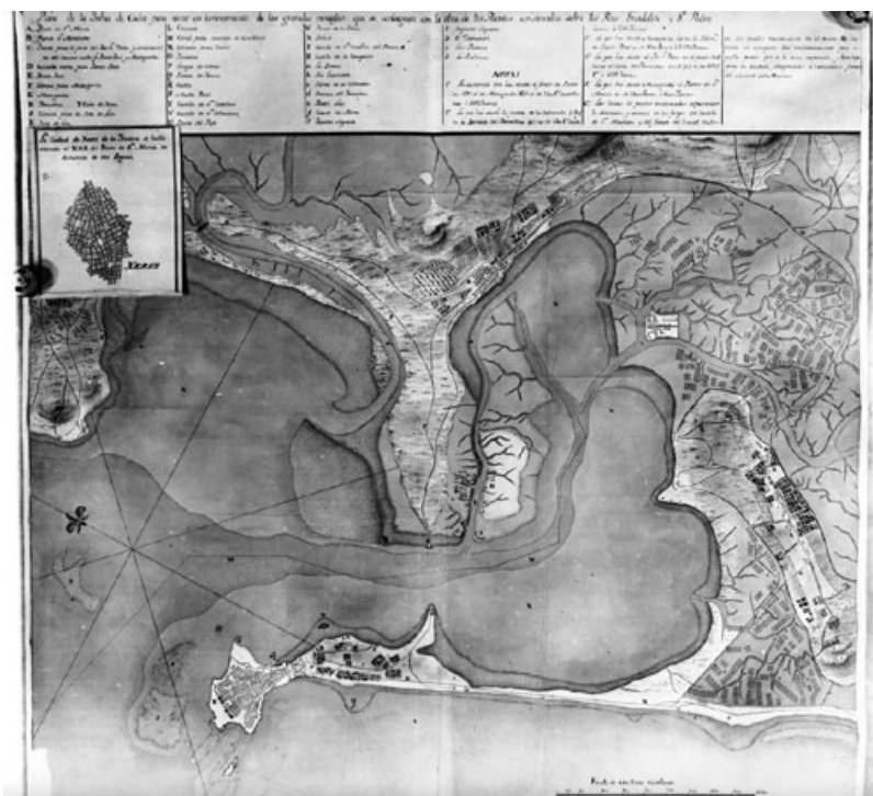
Figura 1. “Plan de la Bahía de Cádiz para venirse en conocimiento de las grandes ventajas que se consiguen con la obra de los Puentes construidos sobre los Rios Guadalete y Sn. Pedro”. B.N.M. Signatura Mr/43/032.

Fecha de aceptación: 28 de noviembre de 2011.