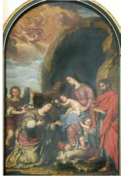
Figura 2 . José Risueño, Coronación de Santa Rosalía , 1720. Granada, catedral (tránsito hacia la sacristía).