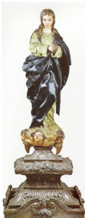
Figura 9. Alonso Cano, Inmaculada , 1655-1656. Granada, catedral (sacristía).