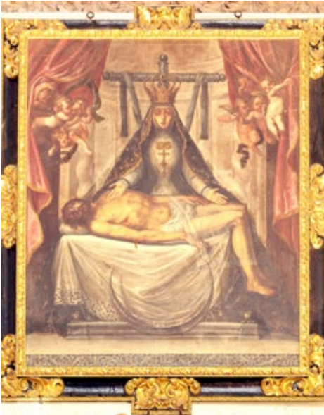
Figura 3. José Risueño, Virgen de las Angustias , 1698. Granada, catedral (museo).