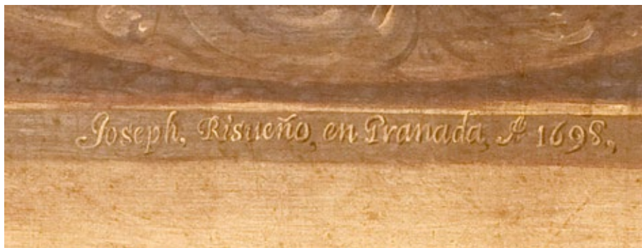
Figura 4. José Risueño, Virgen de las Angustias (detalle), 1698. Granada, catedral (museo).