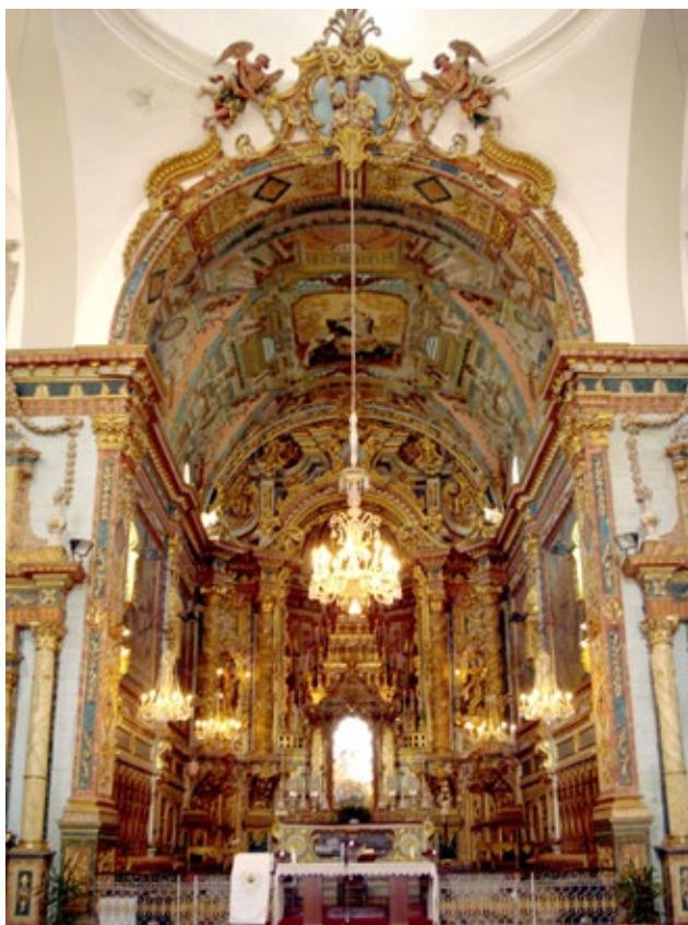
Fig. 5. Aspecto geral do arco da capela-mor da igreja da Ordem Terceira de Nossa Senhora do Carmo de Tavira. ( Foto do autor ).