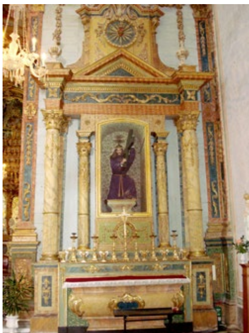
Figura 2. Retábulo colateral (Epístola) do Senhor dos Passos, na igreja da Ordem Terceira do Carmo de Tavira. (Foto do autor).