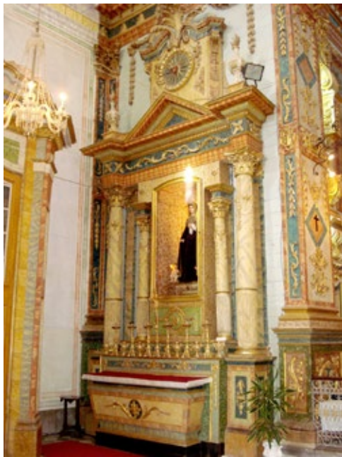
Figura 1. Retábulo colateral (Evangelho) de Nossa Senhora das Angústias, na igreja da Ordem Terceira do Carmo de Tavira.