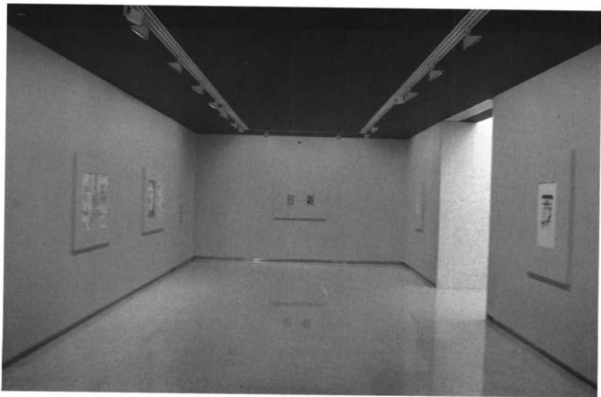
Obra en papel en la Colección El Monte. Centro Cultural Fundación El Monte, Sevilla.