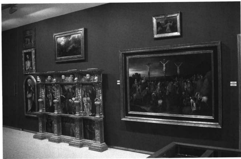
6ª subasta. AIG. Centro Cultural Fundación El Monte. Sevilla.