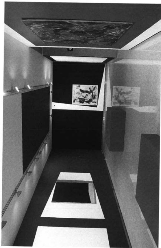
Lenguajes. 2000. Centro Cultural Fundación El Monte. Sevilla.