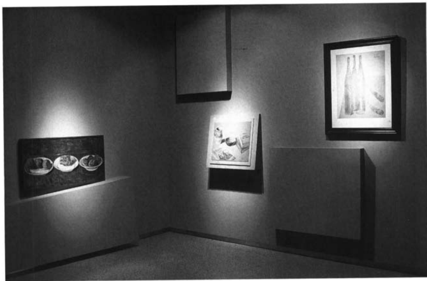
Lenguajes . 2000. Centro Cultural Fundación El Monte. Sevilla.