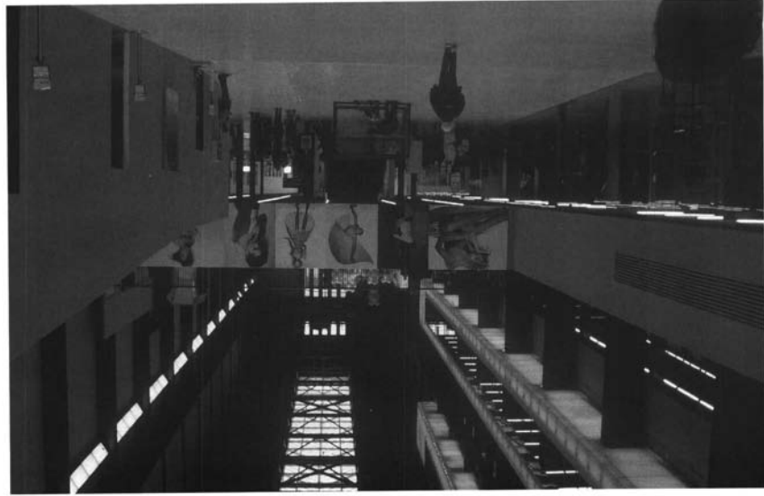
Hall de entrada. Tate Modern, Londres.