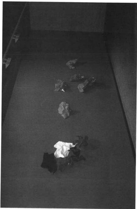
Call me. Centro Cultural El Monte, Sevilla.