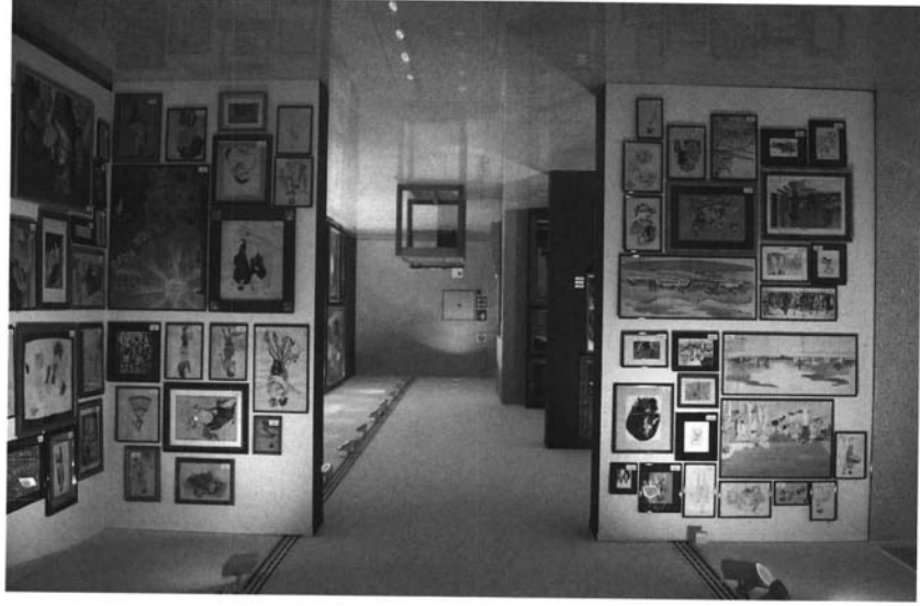
6ª subasta. AIG. Centro Cultural Fundación El Monte. Sevilla.