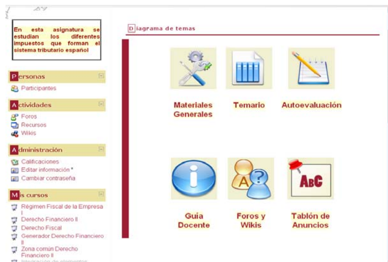
Figura 2. Asignatura Derecho Financiero II

Los tres iconos de la línea de arriba (ver figura 2) dan acceso al material compartido depositado en el curso generador de contenidos. Además, se han incluido iconos propios de la asignatura que permiten navegar a través de los materiales y actividades docentes específicas de la asignatura Derecho Financiero II (guía docente de la asignatura, tablón de anuncios y otras utilidades de diverso tipo).