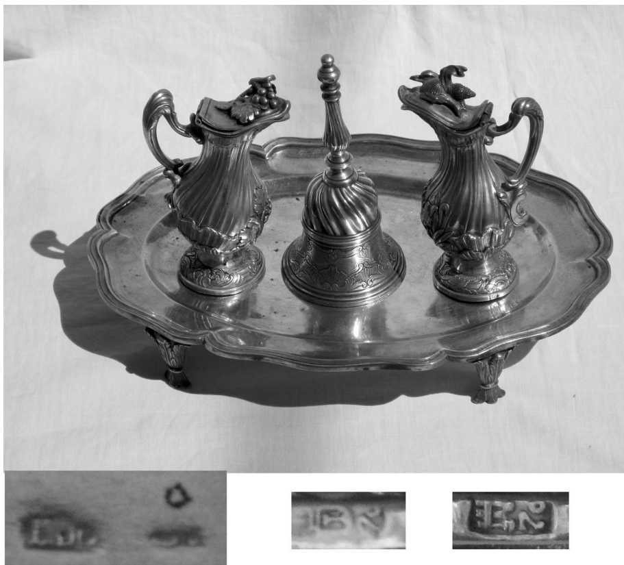
Figura 5. Salvilla con pies, vinajeras, campanilla y marcas de Planes.