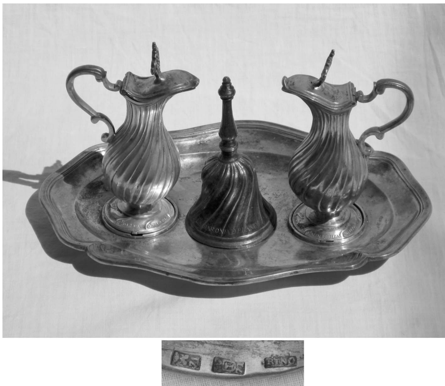
Figura 7. Bandeja, vinajeras, campanilla y marcas de la bandeja de Catamarruc.