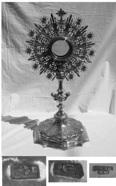
Figura 2. Custodia y marcas de la iglesia parroquial de Planes.