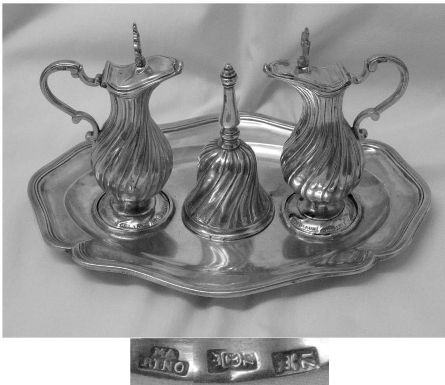
Figura 9. Bandeja, vinajeras, campanilla y marcas de la bandeja de Almudaina.