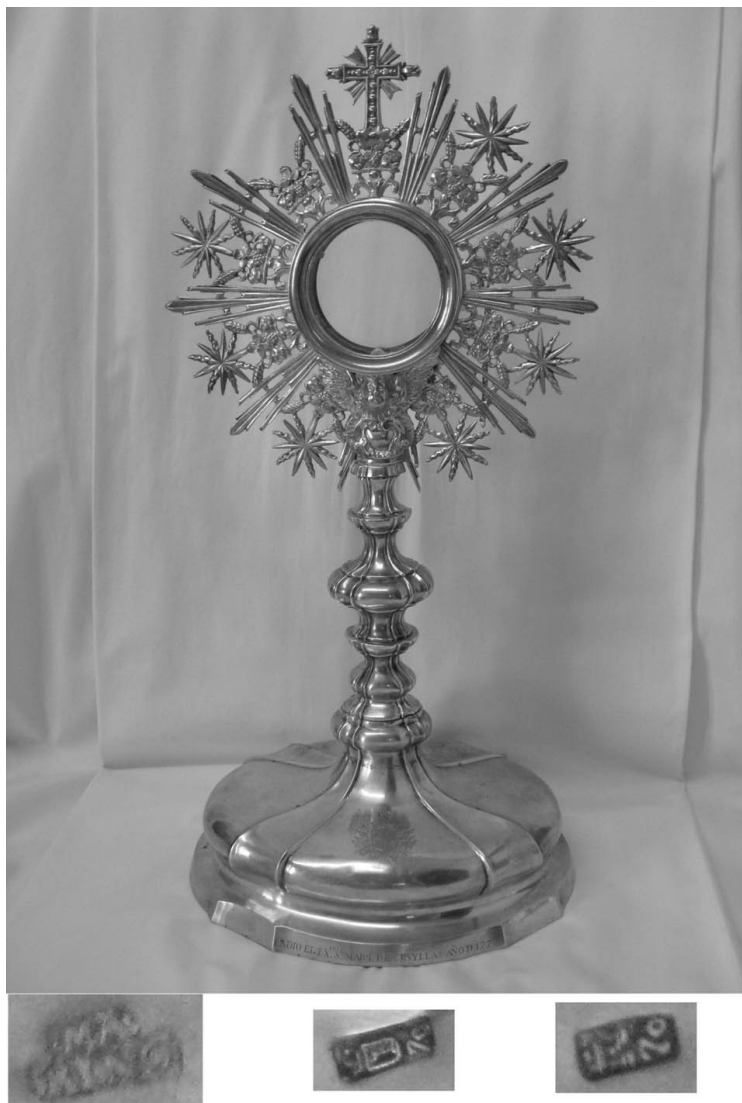
Figura 8. Custodia y marcas de la iglesia parroquial de Almudaina.