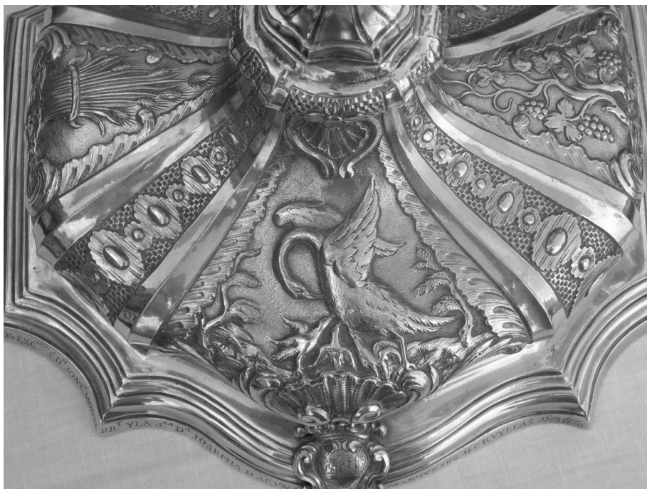
Figura 4. Detalle del reverso de la base de la Custodia de Planes.