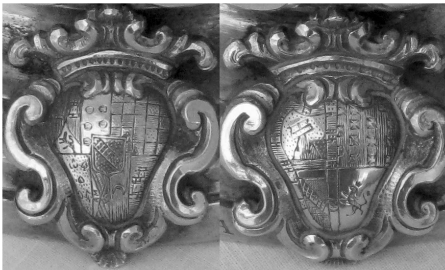
Figura 3. Escudos con las armas de los I marqueses de Cruilles de la custodia de Planes.