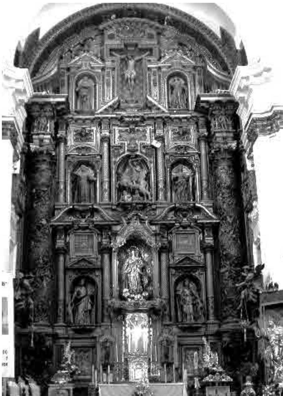
2. Alejandro de Saavedra. Retablo mayor, Iglesia de Santa Cruz, Catedral Vieja, Cádiz.