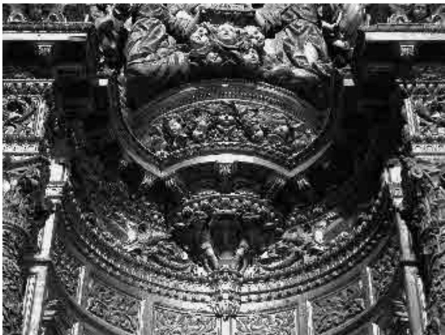
3. Alejandro de Saavedra. Retablo mayor (detalle), Iglesia de Santa Cruz, Catedral Vieja, Cádiz.