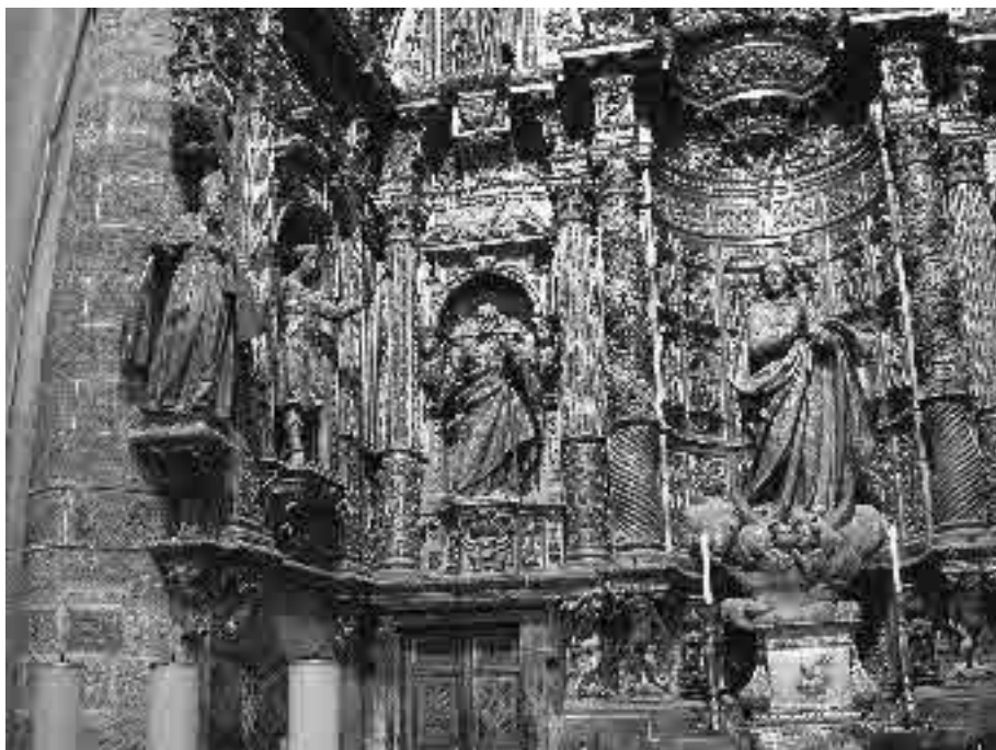
1. Alejandro de Saavedra. Retablo mayor, Iglesia de Santa Cruz, Catedral Vieja, Cádiz.