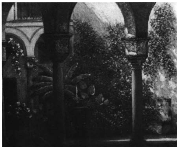
Patio de Triana. 01. 1944.