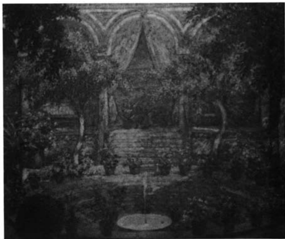
Patio de los Venerables. 01. Propiedad particular. Sevilla.