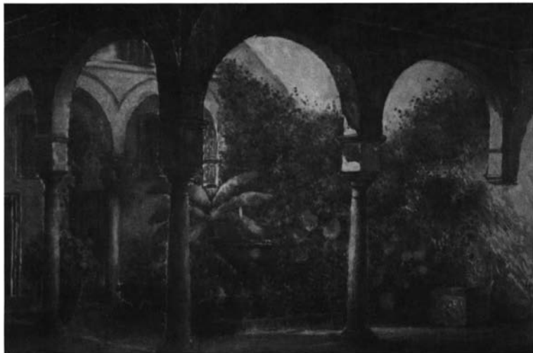
Patio del artista. Acuarela. 1960. Propiedad particular. Sevilla.