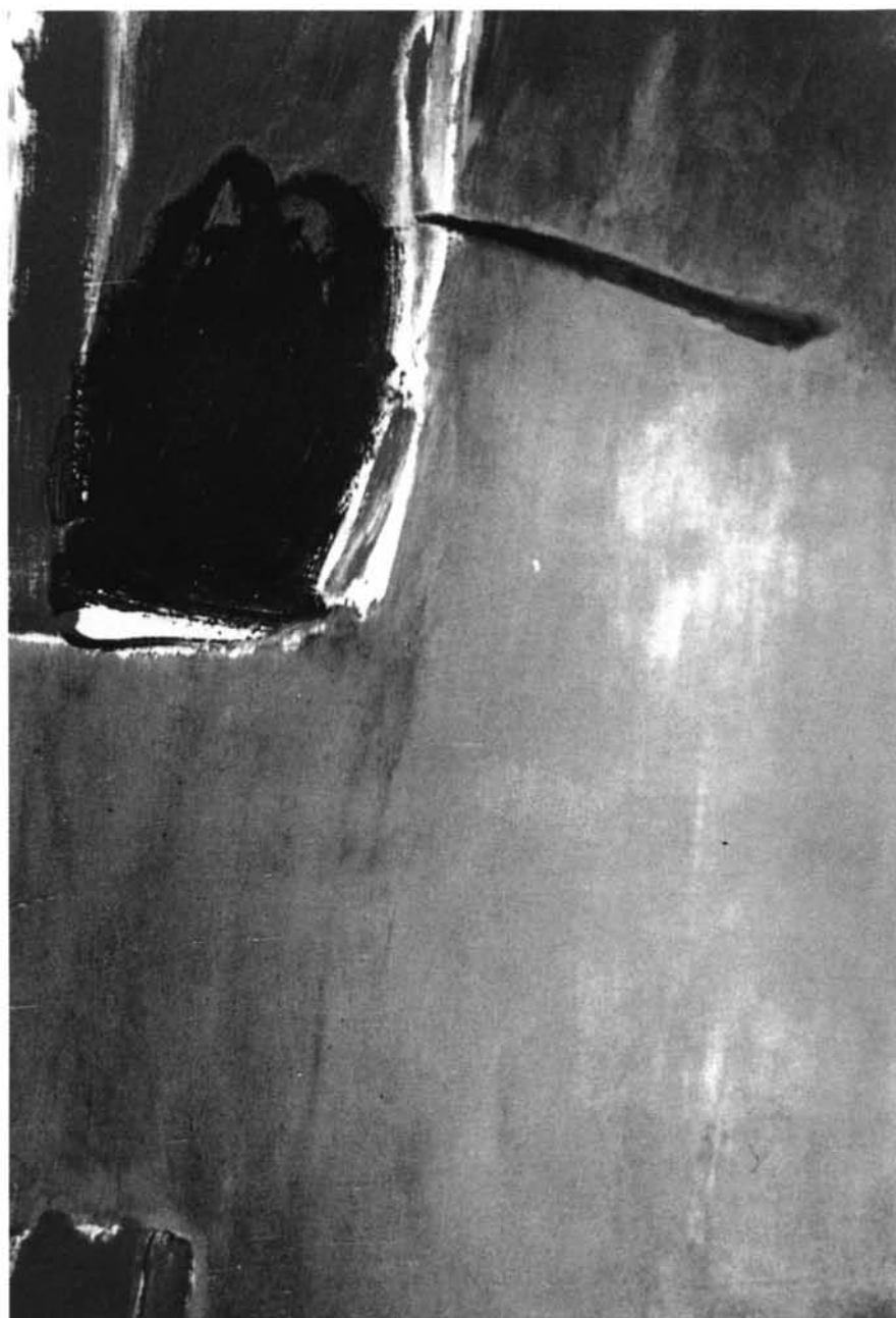
Lám. 6 "Azural", 1987. Técnica: óleo. Autor: José Guerrero.