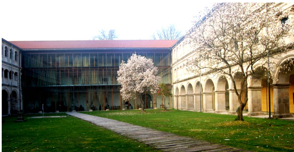
Fig. 5. Parador de Santo Estevo de Ribas de Sil. Claustro Grande

Con el cambio de siglo tiene lugar una de las mayores inversiones de la historia de la Red desde los años sesenta con la intención de poner a punto las instalaciones desgastados de los edificios de la empresa y llevar a cabo una gran campaña de rehabilitación de edificios tan emblemáticos como los paradores de Santo Estevo de Ribas de Sil, Limpias, Lerma o Monforte de Lemos.