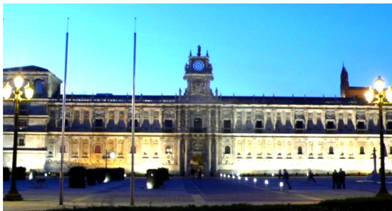
Fig. 4. Hostal de San Marcos en León

Al mismo tiempo, tiene lugar la creación de dos de los establecimientos más emblemáticos de la red: el Hostal de San Marcos de León y el Hostal de los Reyes Católicos en Santiago de Compostela. En esta época forman parte de la Empresa Nacional de Turismo (ENTURSA), todavía tardarán un par de décadas en llegar a formar parte del organigrama de la Red de Paradores, cuando ENTURSA se privatiza durante el periodo en que Miguel Boyer ostenta la cartera de Economía.