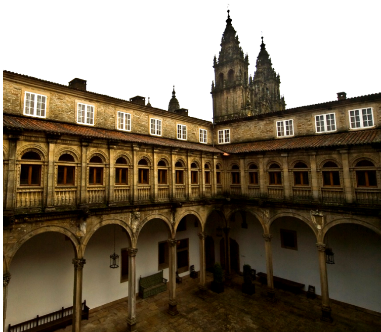
Fig. 8. Uno de los cuatro patios del Hostal de los Reyes Católicos de Santiago de Compostela.

El Hostal de los Reyes Católicos en Santiago de Compostela por ejemplo, es un edificio con categoría de cinco estrellas gran lujo pero carece de SPA, su capacidad de aparcamiento es muy reducida y su adecuación a las medidas de accesibilidad es discutible. ¿Significa esto que dada la tendencia turística actual podría peligrar la categoría de un edificio tan emblemático e inigualable? 7