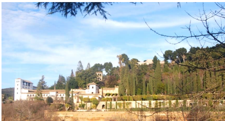
Fig. 7. Vistas del Generalife desde el Parador de Granada.

El Hostal de los Reyes Católicos en Santiago de Compostela por ejemplo, es un edificio con categoría de cinco estrellas gran lujo pero carece de SPA, su capacidad de aparcamiento es muy reducida y su adecuación a las medidas de accesibilidad es discutible. ¿Significa esto que dada la tendencia turística actual podría peligrar la categoría de un edificio tan emblemático e inigualable? 7