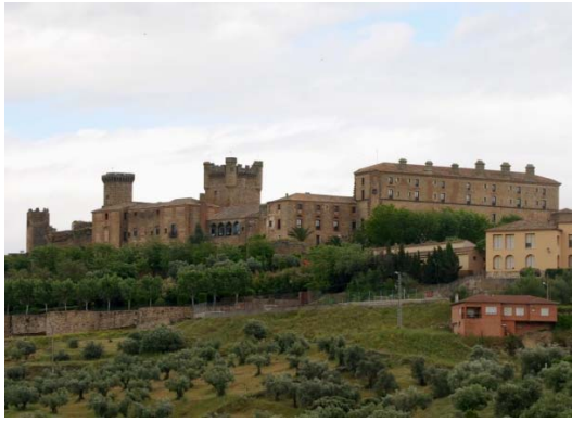
Fig. 1. Parador de Oropesa de Toledo