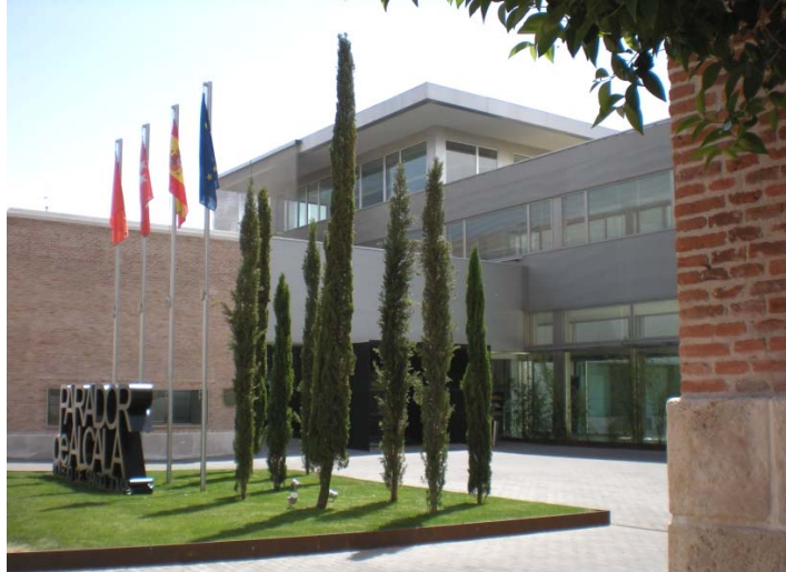
Fig. 6. Parador de Alcalá de Henares

En cuanto a los paradores que se conformaron en aquella primera etapa, se utilizarán preferentemente los términos “adaptación”, “remodelación” o “intervención” en el patrimonio, evitando emplear el término “rehabilitación”, ya que las intervenciones que tienen lugar hasta la promulgación de la LPHE no se someten a los criterios de rehabilitación que hoy en día son internacionalmente aceptados, debido al momento histórico en que fueron proyectados.