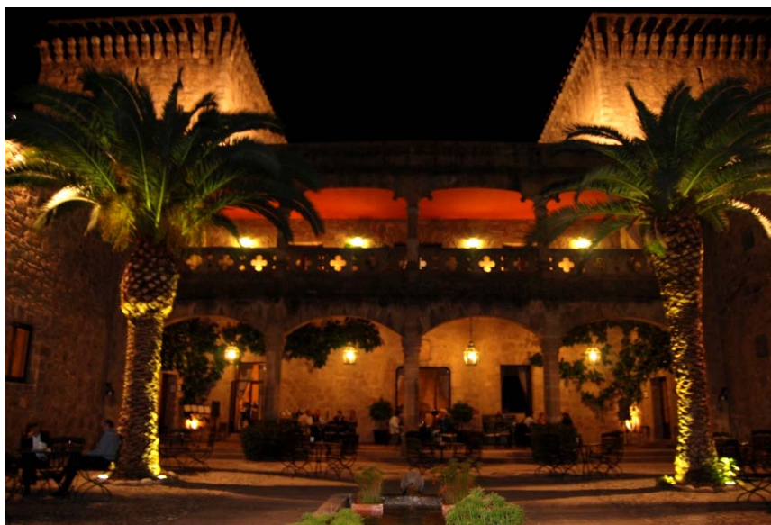
Fig. 3. Parador de Jarandilla de la Vera

Al mismo tiempo, tiene lugar la creación de dos de los establecimientos más emblemáticos de la red: el Hostal de San Marcos de León y el Hostal de los Reyes Católicos en Santiago de Compostela. En esta época forman parte de la Empresa Nacional de Turismo (ENTURSA), todavía tardarán un par de décadas en llegar a formar parte del organigrama de la Red de Paradores, cuando ENTURSA se privatiza durante el periodo en que Miguel Boyer ostenta la cartera de Economía.