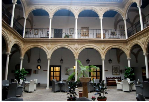
Fig. 2. Parador de Úbeda

Es interesante resaltar como la Red de Paradores de Turismo de España ha sobrevivido al devenir temporal y a los cambios políticos fruto de la historia más reciente de nuestro país sin que nunca se haya puesto en duda su interés como instrumento de la política turística española e incluso podríamos decir de la política de conservación del patrimonio, en lo que atañe a los inmuebles históricos. Sus edificaciones muestran los diferentes criterios de rehabilitación que se han llevado a cabo en el siglo XX en España, suponiendo el fin de la Dictadura y, posteriormente, la promulgación de la Ley 16/85 de Patrimonio Histórico Español (LPHE) un punto de inflexión.