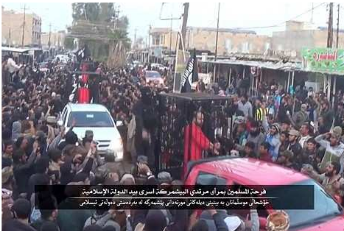
Imagen capturada del video difundido por el EI en Iraq.

El documental 123 titulado: “ Curando así los pechos de gente creyente ” difundido por el EI en Iraq en febrero de 2015, encarna el empleo propagandístico del ritual por parte del grupo. En este video los presos de la milicia kurda, Peshmerga, están siendo transportados en jaulas transportadas en vehículos. Antes de ejecutarlos estos vehículos forman un desfile que pasea por la ciudad iraquí de Mosul, donde las multitudes vocean en las carreteras donde pasa el desfile. Esta escena está descrita en un subtítulo tanto en árabe como en kurdo con las siguientes palabras: “La alegría de los musulmanes por la vista de los infieles de la Peshmerga presos en manos del EI ”.