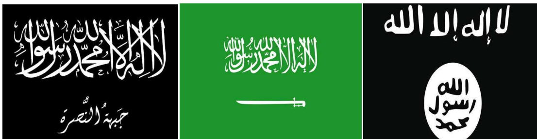
Bandera del Frente Alnusra.

Desde su establecimiento, esta organización ha manteniendo el mismo distanciamiento con el EII y Alqaeda central, muestra de ello es el manifiesto fundacional 61 de la organización, publicado por la productora Almanara a principios del 2012, presentado por su fundador Abu Mohamed Aljoulani y donde no se hace mención a Alqaeda ni al EII . Desde entonces, se aprecia la intención del Frente Alnusra de mantener su identidad como una organización independiente. Para marcar mayores diferencias con el EII , el Frente Alnusra elaboró su propia simbología, como la bandera, que no se asemeja a la del EII , más bien es una réplica de la insignia de Arabia Saudí, destacando la misma escritura y caligrafía, aunque con el fondo negro.