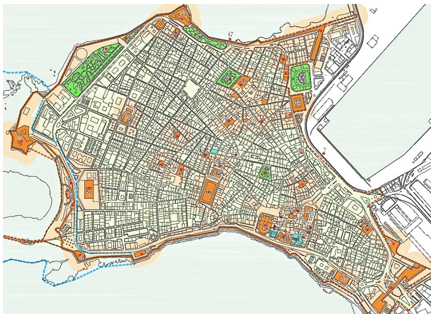
Figura 2. Conjunto Histórico de Cádiz (delimitación en línea discontinua naranja).