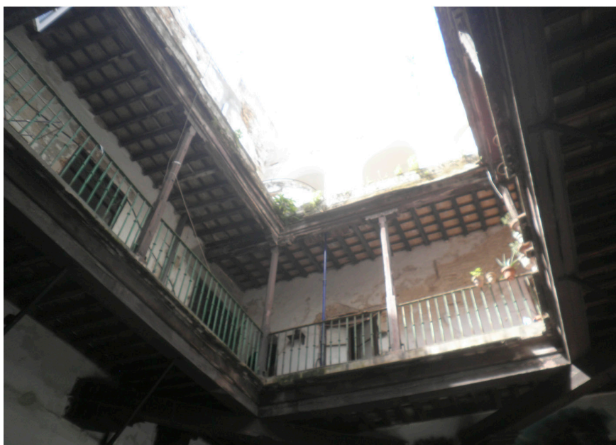
Figuras 4 y 5. Imágenes actuales de la casa-palacio. Arriba, fachada exterior. Abajo, balconada interior (al patio central) de la primera planta.