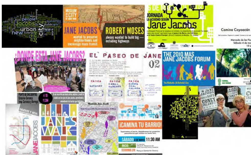
Fig 1. Imágenes de revivalismo de Jane Jacobs, todas ellas posteriores a la crisis de 2008, y la portada de la reciente reedición de su libro "Muerte y vida de las grandes ciudades" -americanas, incluía el original- que alcanzó casi inmediatamente su segunda edición [1] (elaboración propia).

Desde el comienzo de la crisis de 2008, se ha producido un generalizado refloramiento de los movimientos de participación ciudadana y urbanismo "bottom-up". Partiendo de una postura pretendidamente contestataria, la tendencia ha ido generando un consenso que ya alcanza cotas de hegemonía, monopolizando buena parte del debate y, en no pocos casos, rechazando posibles ideas alternativas como demodé y antidemocráticas.