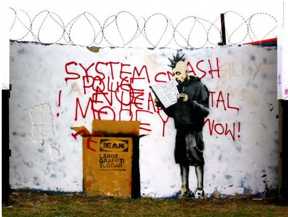
Fig 8. Graffiti atribuido a Ralph Basky, en Croydon, Londres (Flickr user 303db, http://creativecommons.org/licenses/by-nc/2.0 )

Žižek describe la situación con la diatriba cruel entre el pícaro y el tonto: "Caído el régimen comunista, el pícaro es el neoconservador defensor del libre mercado, aquel que rechaza crudamente toda forma de solidaridad social por ser improductiva expresión de sentimentalismos, mientras que el tonto es el crítico social "radical" y multiculturalista que, con sus lúricas pretensiones de "subvertir" el orden, en realidad lo apuntala" [34].