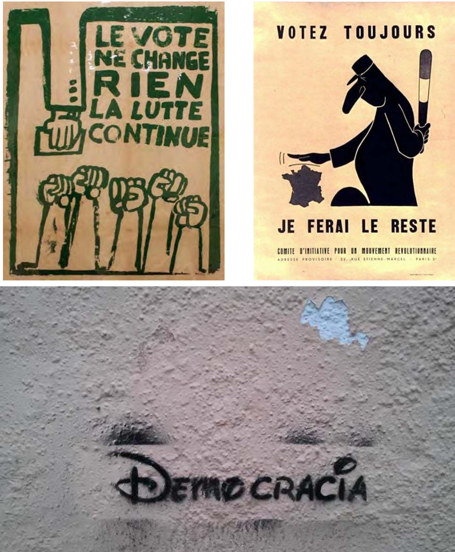
Fig 6. Arriba, cartelera de mayo del 68 francés. Abajo, pintada callejera actual. Situadas en ámbitos potencialmente recidivantes (ver fig. 1), ambas comparten un descreimiento de la democracia, aunque por motivos acordes a sus distintas épocas. Si las primeras aluden a la manipulación por parte de un Estado paternalista, la segunda se refiere más a una ocultación espectacular y festiva, pero también taimada, por parte de las empresas multinacionales, incluso las aparentemente más inocentes. Sus resultados no son menos dañinos por menos evidentes.

adecuado desarrollo. La decisión política queda, pues, excluida o reducida a una mera representación, frecuentemente, de corte populista.