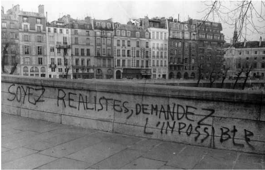
Fig 3. "Sean realistas, pidan lo imposible". El evocador lema de mayo del 68, a la luz de lo expuesto por los autores citados en estos párrafos bien podría leerse desde el lado del nuevo mercado: "pidan (inventen, diseñen) lo imposible, para que podamos hacerlo real... y vendérselo".