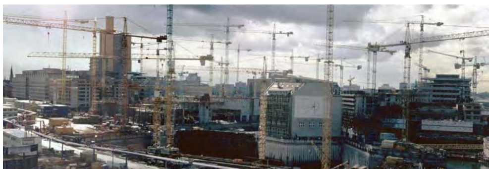
Fig 7. Postdamer Platz, Berlín, abril de 1997. Paroxismo obliterador

Aunque practicado en un número siempre creciente de ciudades, el ejemplo más evidente de este tipo de actuación quizá sea la remodelación del entorno de la Postdamer Platz, en Berlín. En ella se produjo, con gran estruendo publicitario, la convergencia de un buen número de potentes multinacionales y empresas semi-públicas en la total, casi obsesiva obliteración de cualquier rastro del traumático pasado reciente del lugar, atrapado en el mismo eje del telón de acero, en primera línea del frente de batalla del capitalismo y su extinto opuesto 15 .