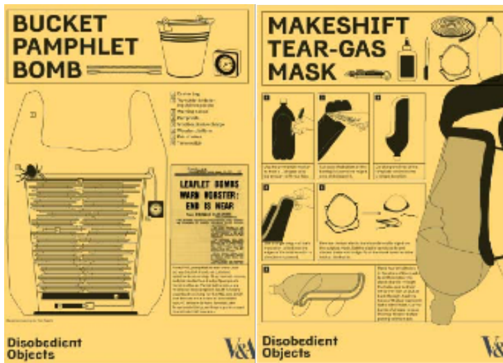
Fig. 2 y 3. Ejemplos de objetos en la exposición Disobedient objects. 2015.

narcisista, que no tiene límites. Por eso entiendo que el límite como especie global debe darlo nuestro planeta, porque es el contexto de la sociedad globalizada.