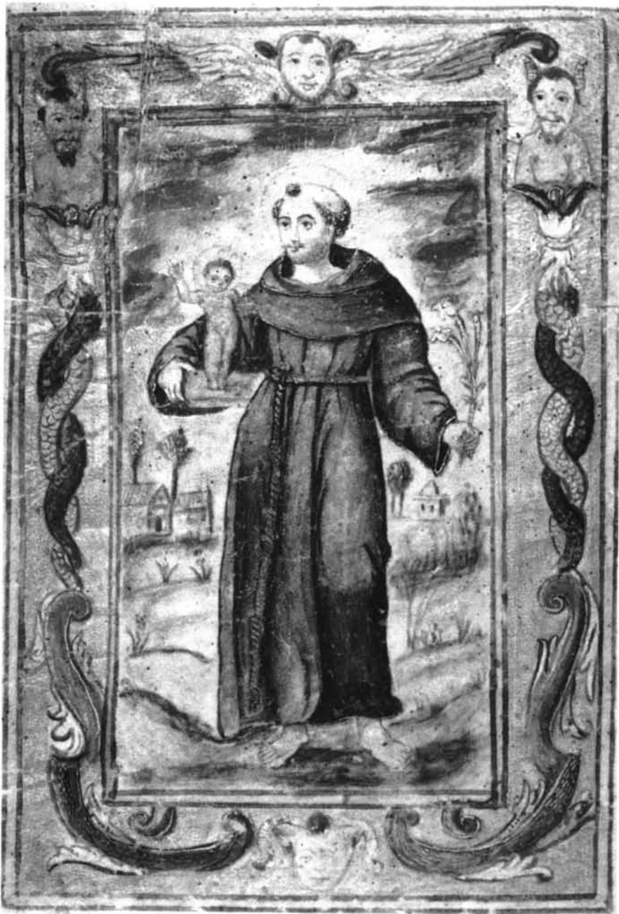
Fig. 3: Libro de Reglas: San Antonio de los Portugueses: Imagen de San Antonio. S. XVII