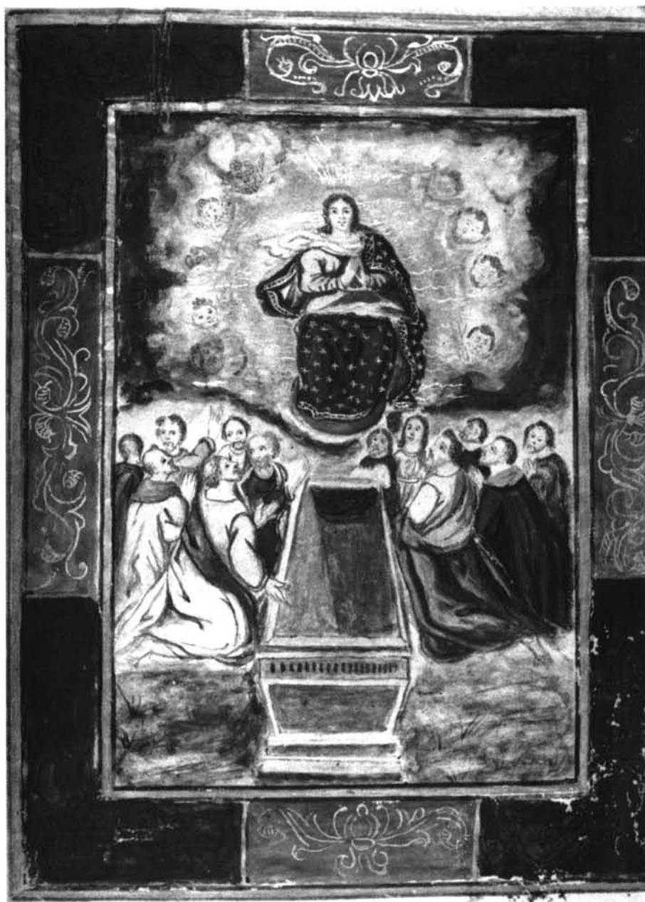
Fig. 1: Libro de Reglas: Hermandad de los Portugueses: Asunción de Ntra. Señora. S. XVII