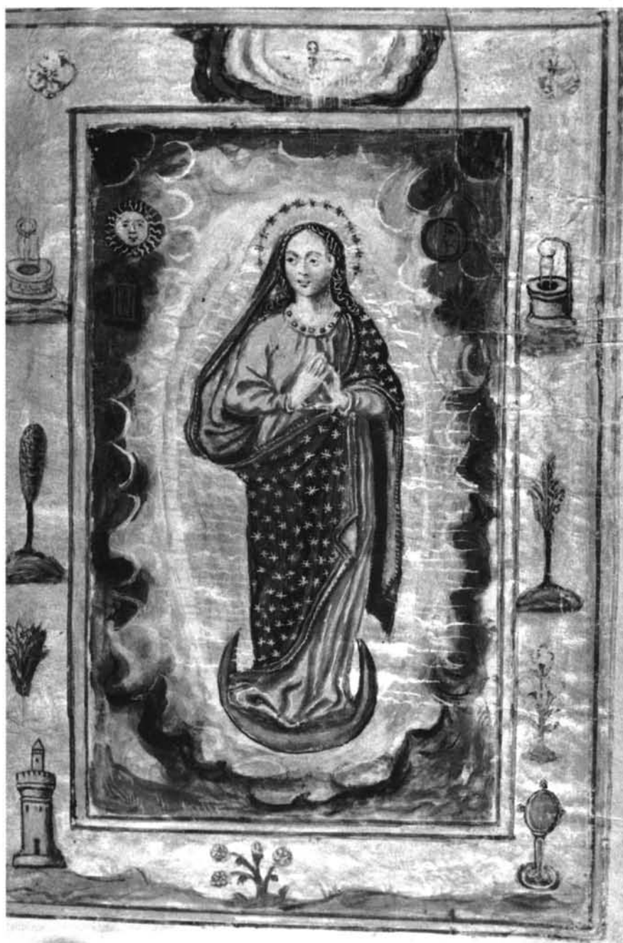
Fig. 2: Libro de Reglas: Hermandad de los Portugueses: Inmaculada Concepción con símbolos lauretanos. S.XVII.