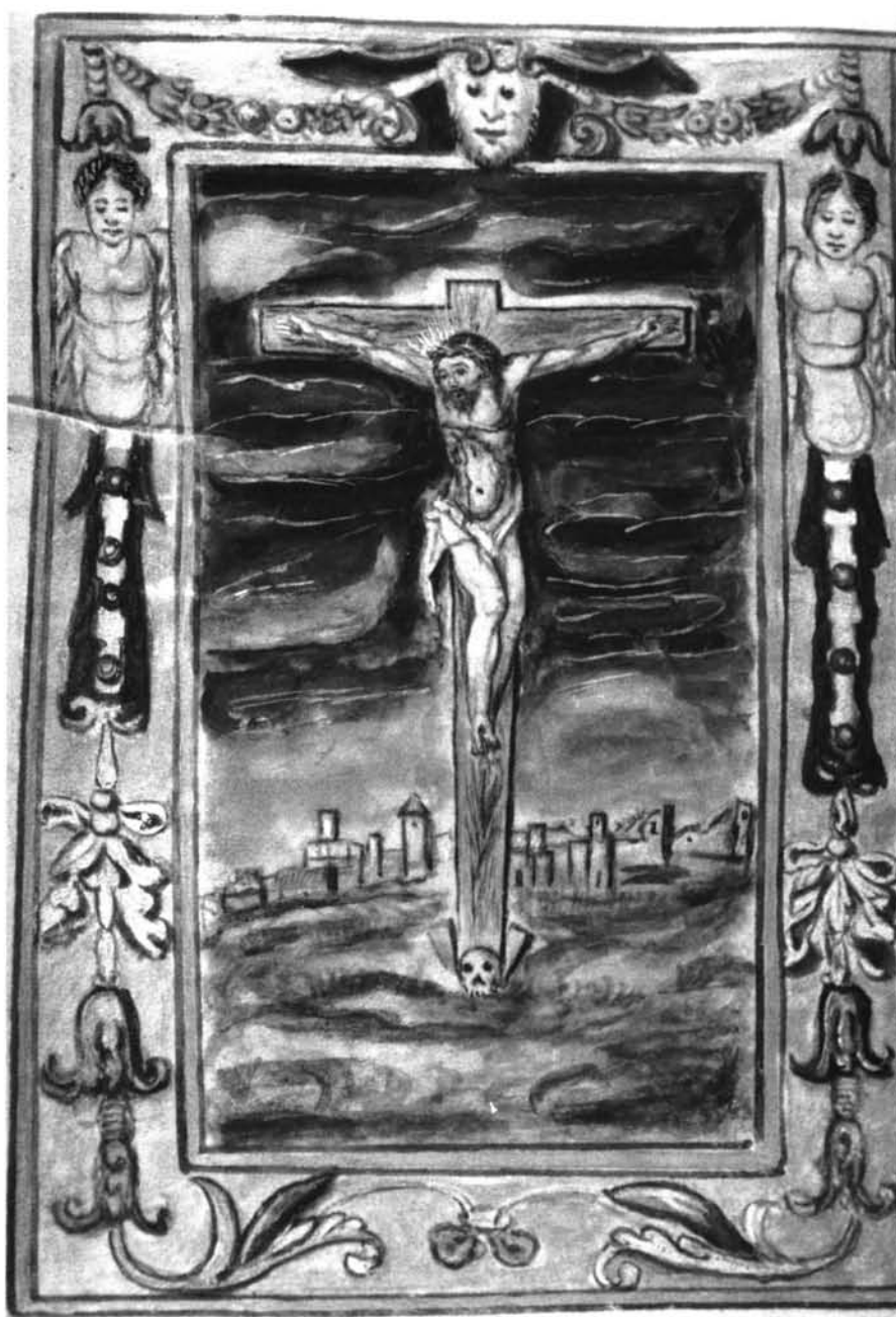
Fig. 5: Libro de Reglas de San Antonio de los Portugueses -Crucificado. S. XVII-