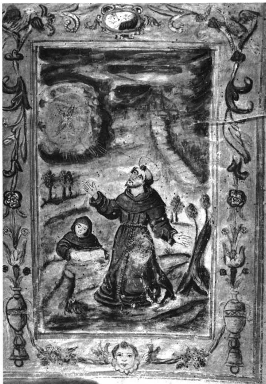
Fig. 4: Libro de Reglas: San Antonio de los Portugueses: Representación de la Estigma de San Francisco. S. XVII.