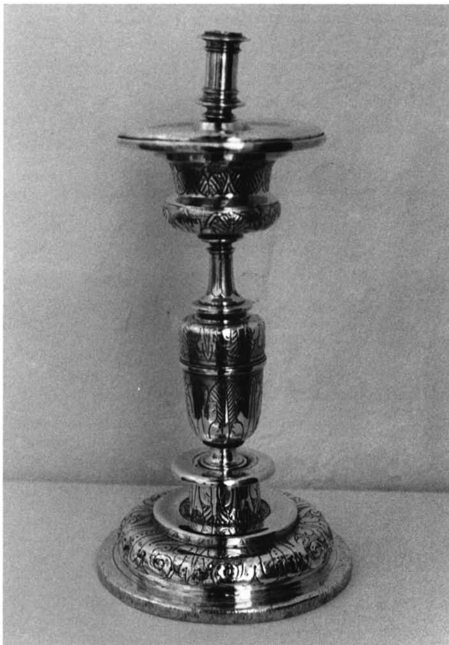
Fig. 4. Blandones.