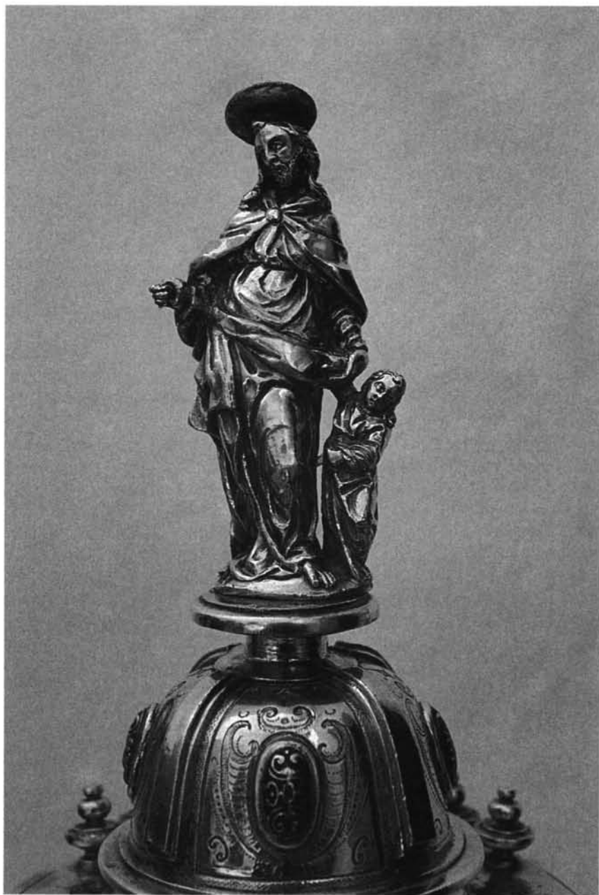
Fig. 8. Escultura josefina que remata el Templete-Ostensorio.