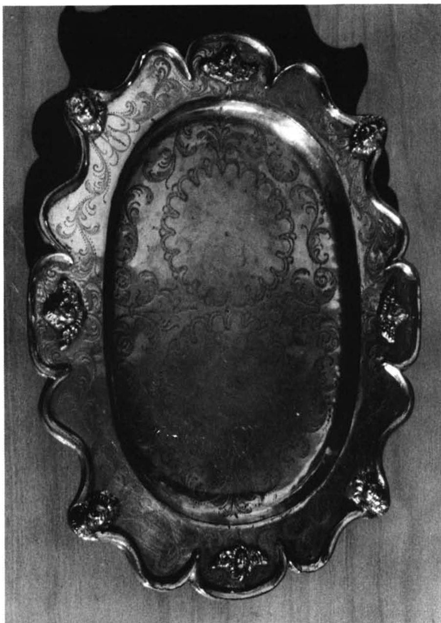
Fig. 3. Salvilla