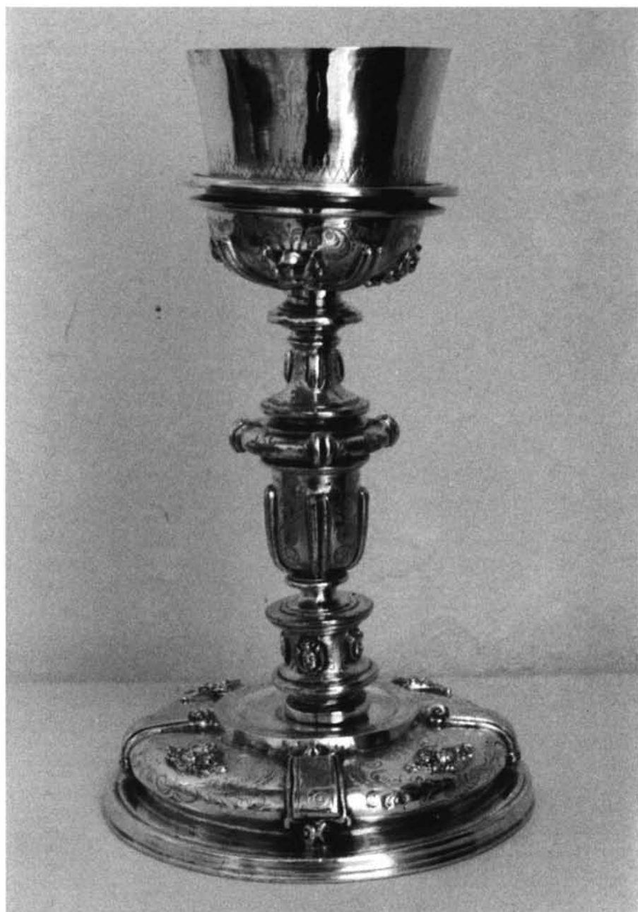
Fig. 2. Cáliz