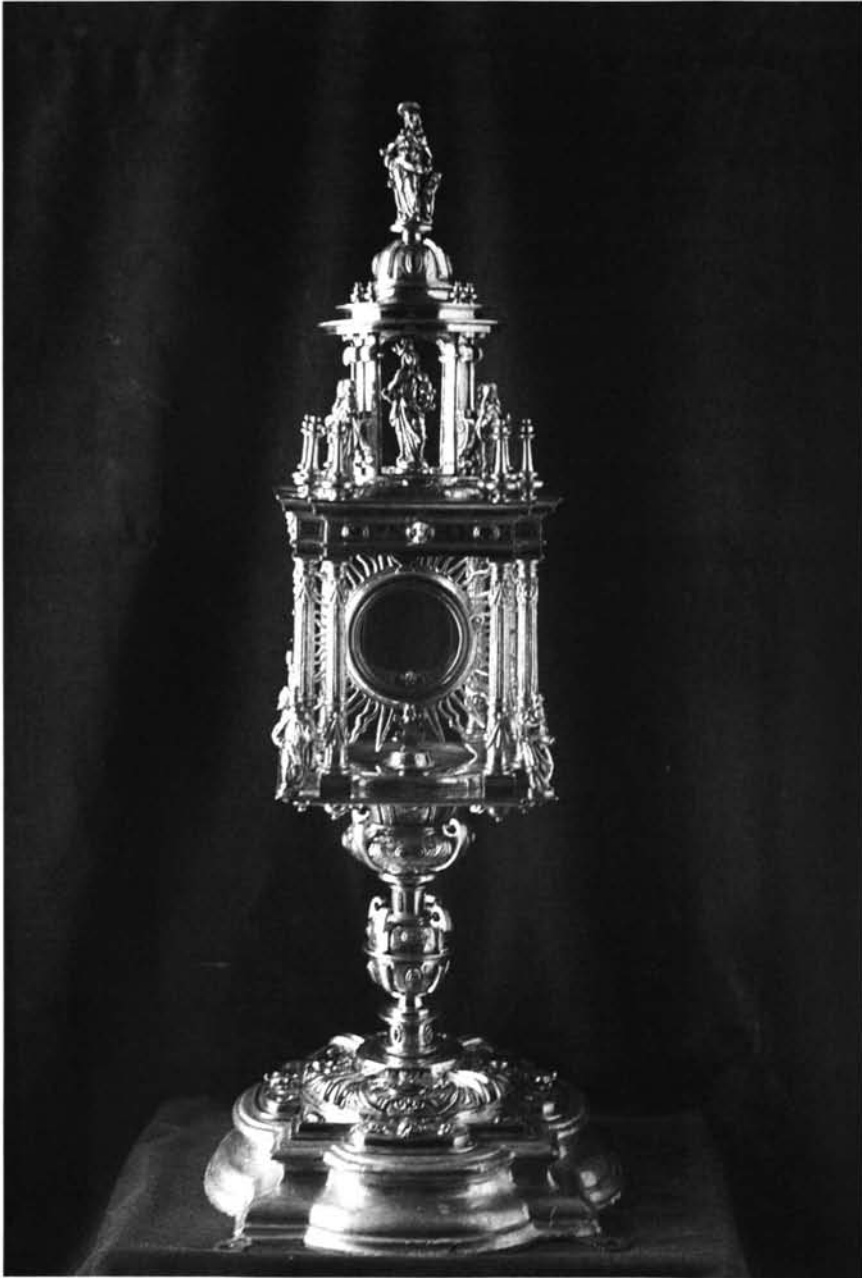
Fig. 5. Templete-Ostensorio.