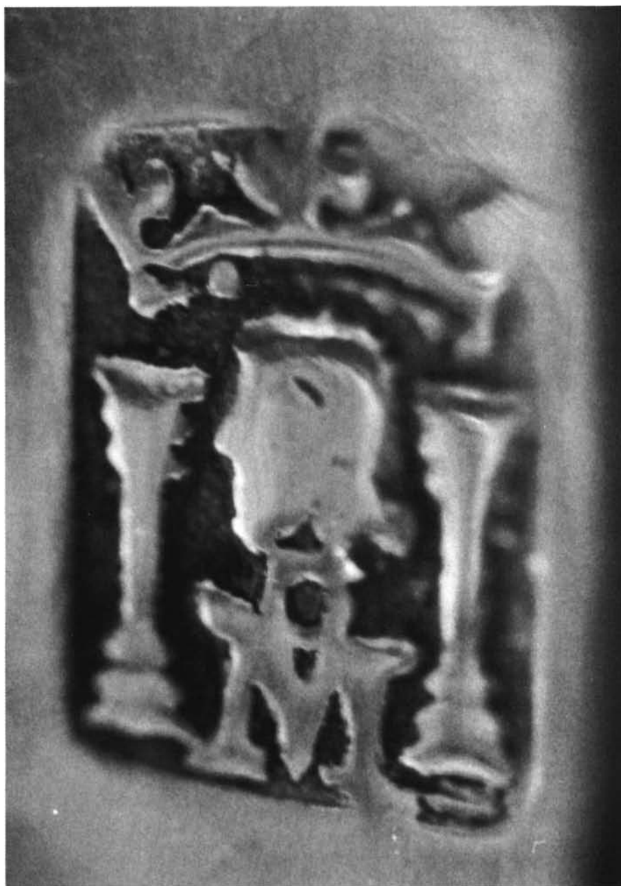
Fig. 9. Punzón de la ciudad de México del Templete-Ostensorio.