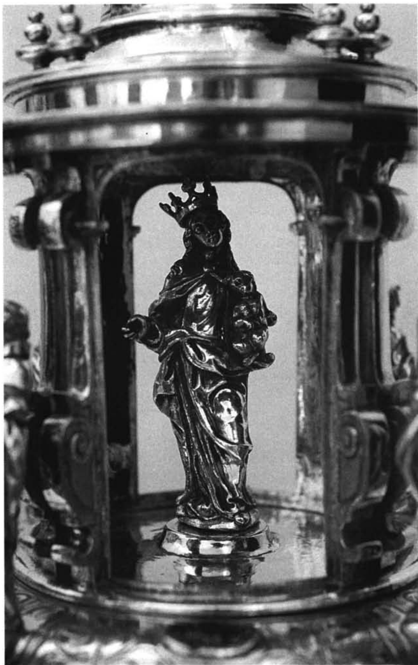
Fig. 7. Segundo cuerpo del Templete-Ostensorio.