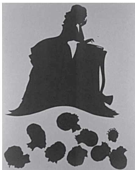
Foto 5. Kara Walker, The Emancipation Approximation (Scene 26) 1999-2000. Serigrafía.

precisas ofrece la individualidad exacta de cada figura. Lavater, en su Essays on Physiognomy, Designed to Promote the Knowledge and Love of Mankind (7), ofrecía ejemplos ilustrativos acerca de una nueva máquina de dibujar siluetas que en la época victoriana se convertiría en uno de los juegos de sociedad más esboga, y que aprovechaba la nitidez de la sombra proyectada en una pantalla para trazar el perfil del retratado.