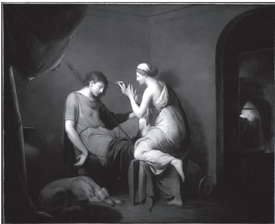
Foto 3. Joseph Wright Derby, The Corinthian Maid , 1782-1784. Óleo sobre tabla.

simbólico a un tiempo. No obstante, el mito de Dibutades, en cierta forma, nos remite nuevamente a la Caverna de Platón. Pues podemos adivinar en él un platonismo implícito en relación a la sombra como copia del natural y la plástica como copia de la sombra. Salvando las distancias, tanto en el mito de Dibutades como en el de la Caverna, la sombra se emplea como elemento alegórico. Valiéndose de la luz y la sombra Platón metaforiza el proceso que guía al hombre hacia la verdad objetiva, hacia el Mundo Inteligible donde residen las Ideas. Platón hace de la luz una analogía de la verdad, y de la sombra sinónimo de la copia. Plinio también relaciona esta última directamente con la representación —con la captación de la sustancia del ser representado— y por lo tanto, en cierto modo, con la copia; aunque prescindiendo del tinte peyorativo con el que Platón se refiere a ella.