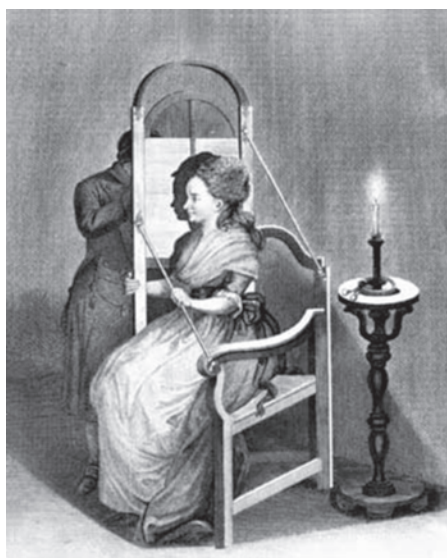
Foto 4. Thomas Holloway. A sure and convenient Machine for drawing Silouettes , 1790. Aguafuerte.