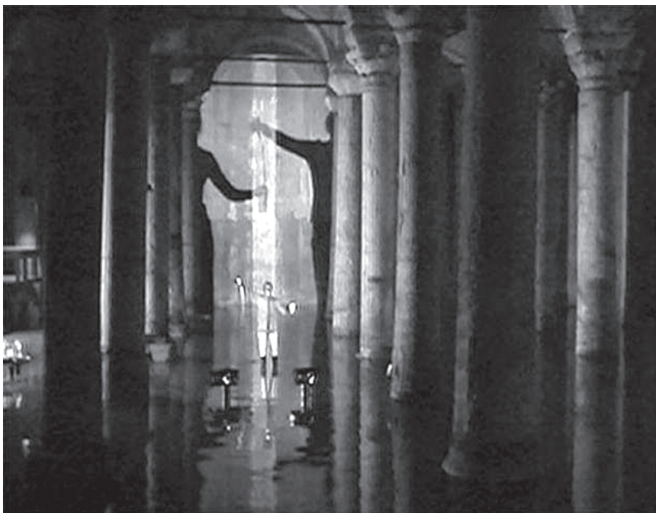
Foto 2. Eulalia Valldosera, Loop , 1995, performance en las Cisternas Yerebatan, Estambul, Turquía.

so esencialmente simbólico, basado en la dualidad entre el bien y el mal, la vida y la muerte, la luz y la oscuridad. De hecho, sus sombras aparecen como entes amenazantes, demoníacas figuras informes que coaccionan al espectador, quien pudiera pensar que acaso ha bajado al infierno de Dante. Sin duda Boltanski confía en el poder de la sombra como vehículo simbólico, capaz de transportar a ese más allá espiritual.