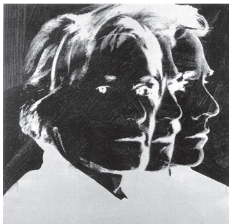
Foto 6. Andy Warhol, Autorretrato (Self-Portrait) , 1978, pintura acrílica y serigrafía sobre lienzo.