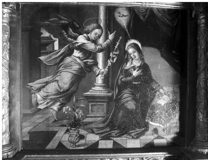
Figura 2. Gerald Wytvel de Utrecht: Anunciación , hacia 1555. Colegiata de Osuna, Panteón Ducal (fotografía: autor).