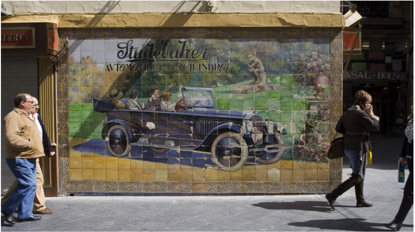
Enrique Orce Mármol. Fábrica Viuda e Hijos de Manuel Ramos Rejano. Azulejo Studebaker. 1924. Sevilla