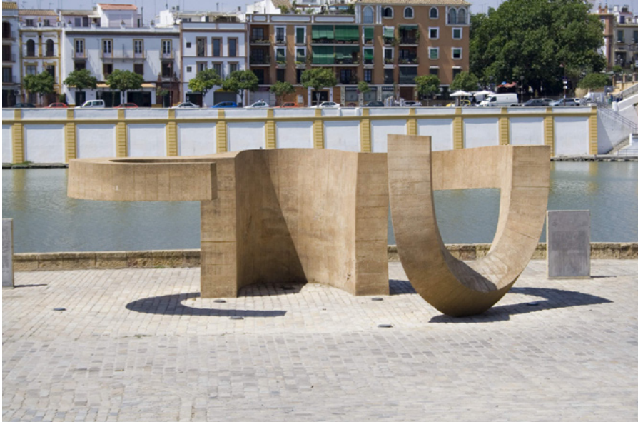
Eduardo Chillida. Monumento a la Tolerancia. 1992. Sevilla

Pese a que el trabajo se basa fundamentalmente en un análisis colectivo del mobiliario urbano, cada uno de los elementos más significativos quedará recogido en otra ficha con una serie de campos agrupados por módulos: