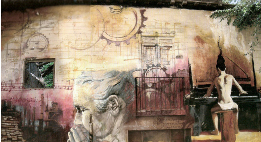
El Niño de las Pinturas. 2005. Granada. Cuesta de los Molinos

presenta un adecuado posicionamiento y orientación en relación con el espacio que ocupa y con la visión y percepción que el ciudadano tiene de él.