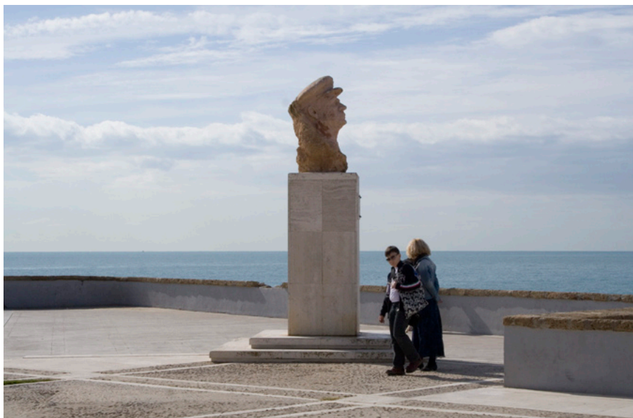
Fernando Benítez. Monumento a Paco Alba. 1979. Cádiz

La documentación gráfica adquiere un papel de gran relevancia puesto que debe recogerse no sólo la trascendencia individual del objeto, sino también su significado espacial y su relación con la ciudad. Ello debe plantear desde el primer momento la realización de un variado número de tomas que sea capaz de convertirse a posteriori en un importante material de estudio para los diferentes tipos de análisis a los que se verán sometidos.