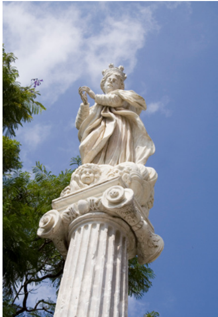
Anónimo. Triunfo de la Inmaculada. 1695. Cádiz