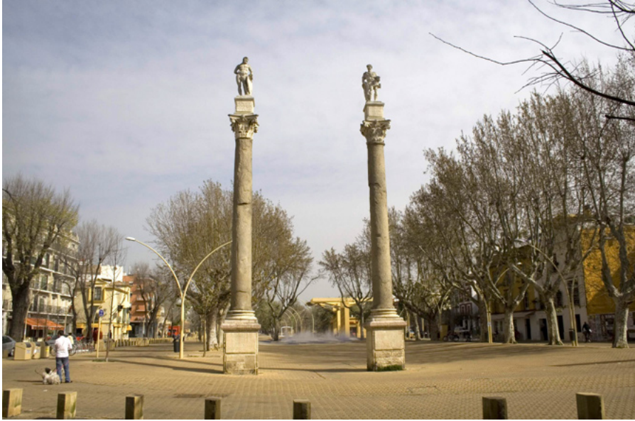
Diego de Pesquera. Columnas de Hércules y César. 1574. Sevilla

contemporáneas como el grafiti 4 . Todos ellos conformarán y diferenciarán a las distintas ciudades, singularizándolas dentro de la cada vez más devastadora globalización.