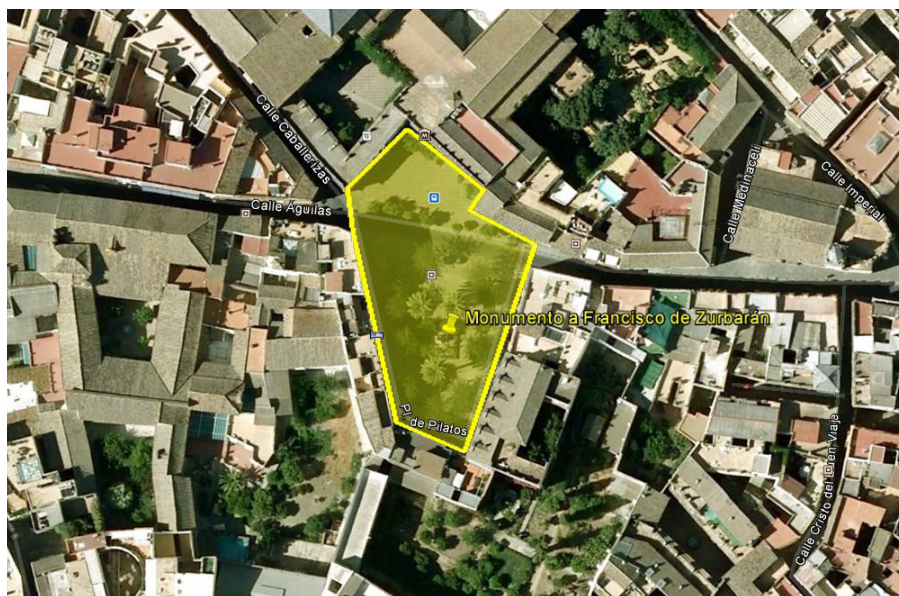
Aurelio Cabrera Gallardo. Monumento a Francisco de Zurbarán. 1929. Sevilla. Vista aérea y plano de localización

El cuarto módulo, quizás el más importante y probablemente el menos usado en este tipo de trabajos hasta el momento, se dedica a los “Indicadores de valoración”, que se analizan más adelante.