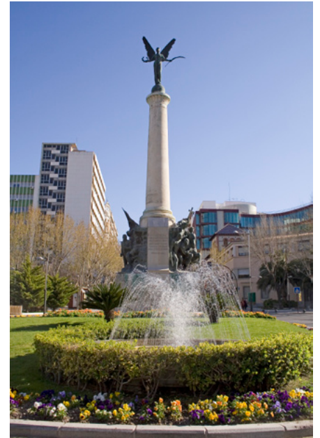
Jacinto Higuera. Monumento a las Batallas. 1910. Jaén

Fuera del ámbito español existen interesantes estudios sobre mobiliario urbano, destacando los de Seixas (1993) o Bebiano (1995) para la ciudad de Lisboa, o el de las francesas Boyer y Rojat-Lefebvre, Aménager les espaces publics: le mobilier urbain (1994).