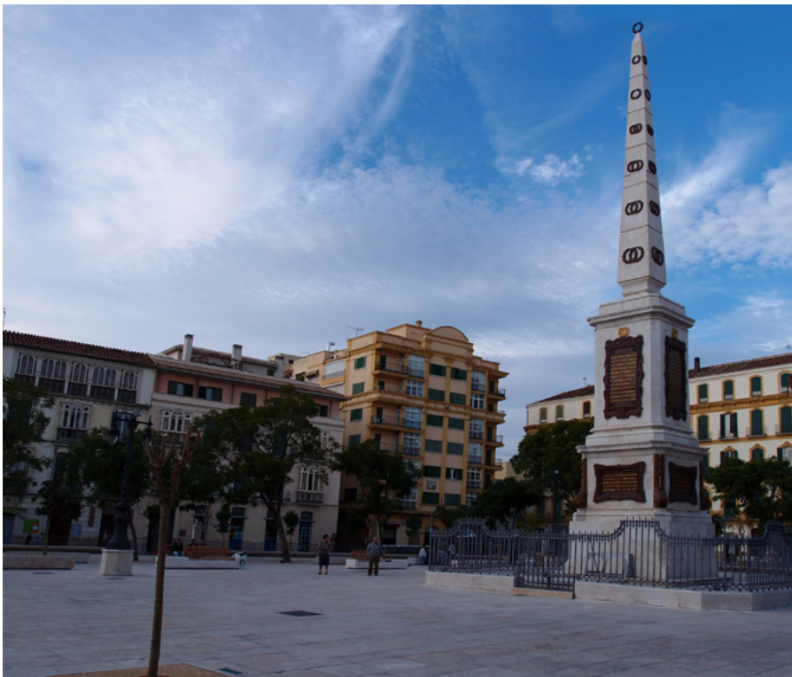
Rafael Miñana. Monumento al General Torrijos y compañeros. 1842. Málaga