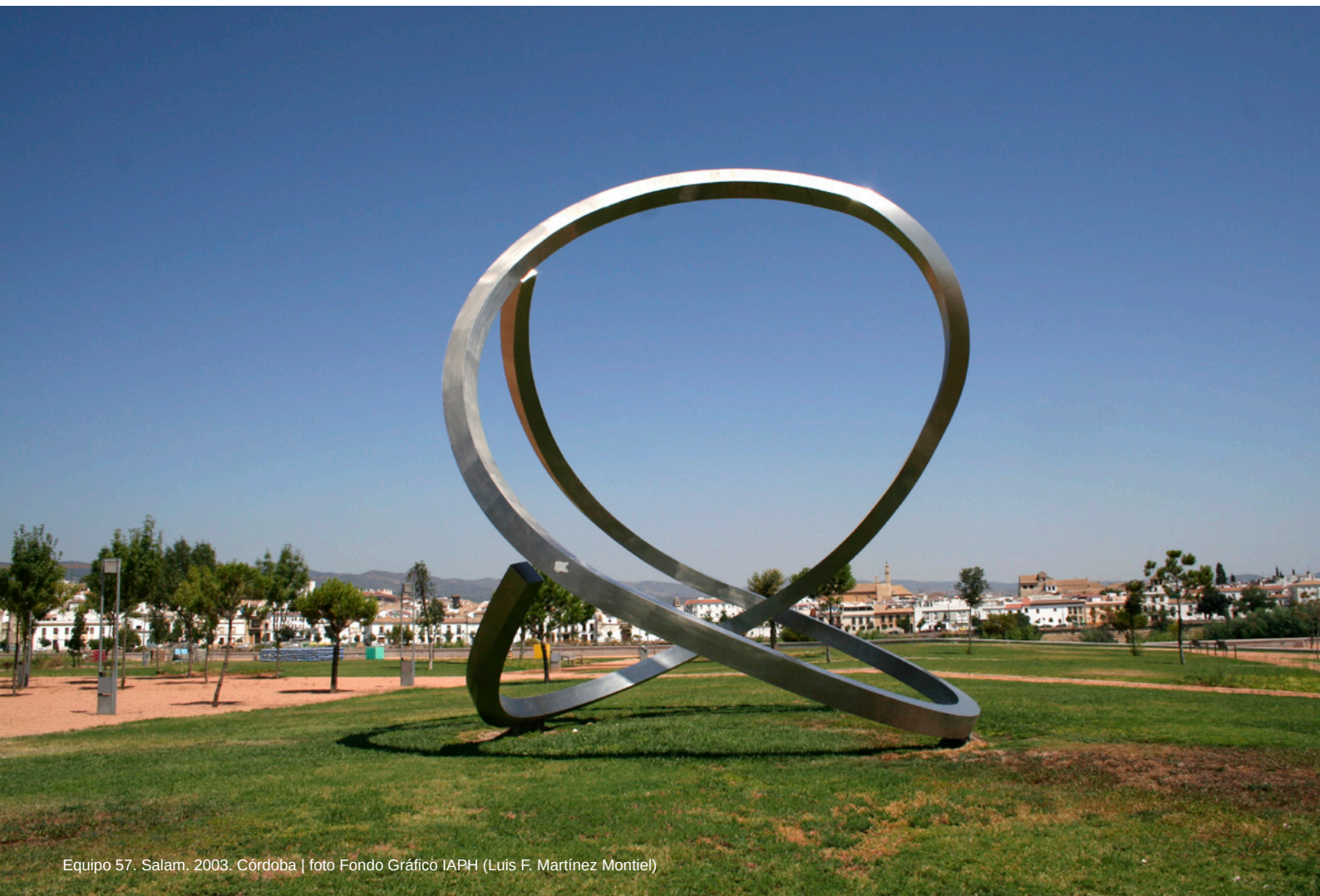
Equipo 57. Salam. 2003. Córdoba