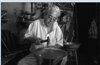
11. La imagen de un artesano portugués trabajando el cobre ilustra una actividad tradicional que se ha mantenido en el conjunto del ámbito.

Tal como ya se ha señalado Mudun, Medinas es una experiencia novedosa en algunos de sus aspectos, sobre todo, en lo que se refiere a la cooperación que lo ha hecho posible y al