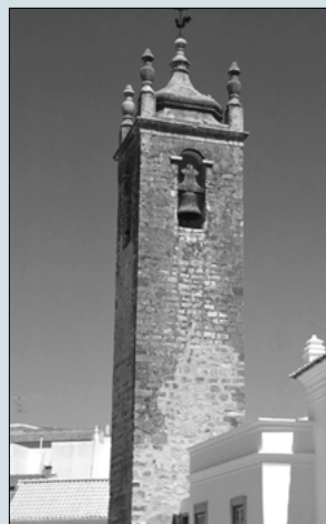
3. Vista de Vejer de la Frontera (Andalucía) con volúmenes y colores característicos en las ciudades del Sur de la Península Ibérica y el Norte de Marruecos.