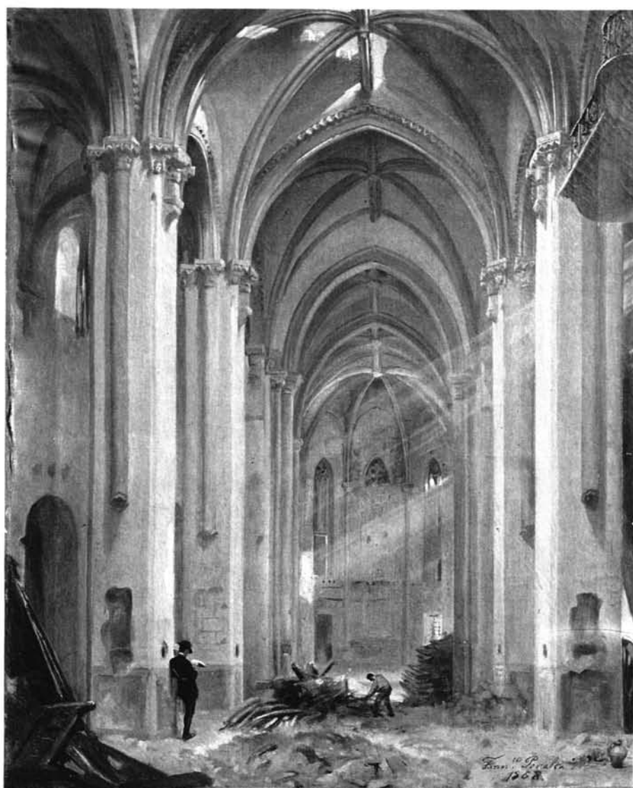
IGLESIA DE SAN MIGUEL DE SEVILLA EN EL ACTO DE COMENZAR SU DERRIBO ORDENADO POR LA JUNTA PROVISIONAL EN EL MES DE OCTUBRE DE 1868

Lámina nº 1: Interior de la parroquia de San Miguel tras su clausura. Lienzo de Francisco Peralta. Sevilla, 1868. Colección particular, Sevilla.