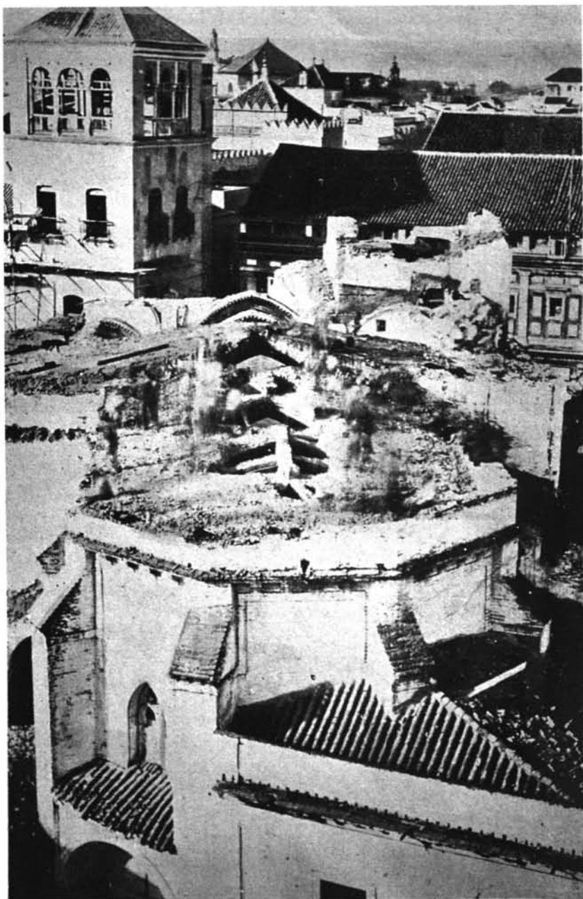
Lámina nº 2: Cabecera de la parroquia de San Miguel antes de su demolición. Noviembre de 1868.