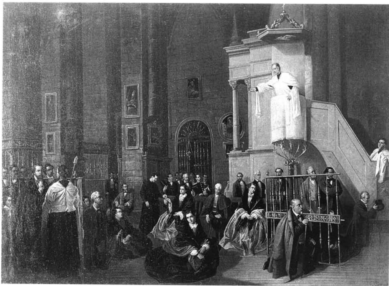
Lámina nº 5: Interior de la parroquia de San Miguel durante un sermón. Lienzo de Francisco Cabral Bejarano. Sevilla, 1857. Colección particular, Sevilla. (Gentileza del profesor Valdivieso.)