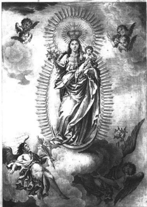
YMAGEN DE N. S. DEL ROSARIO.