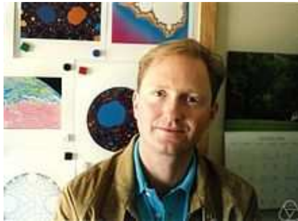
Figura 4. El profesor Curtis McMullen, Director de la Tesis de Maryam

Trabajar con Curt tuvo una gran influencia en mí, aunque ¡Ahora me gustaría haber aprendido más de él! Cuando me gradué tuve una larga lista de ideas en bruto para explorar.