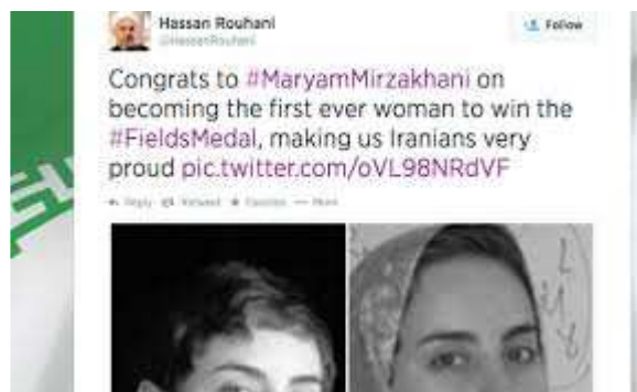
Figura 6. Felicitación del Presidente de Irán

A pesar de que los derechos de las mujeres no están demasiado reconocidos en su país, el Presidente de la República Islámica de Irán en ese año, Hassan Rouhani, la felicitó personalmente por la concesión de esa Medalla Fields (web5).