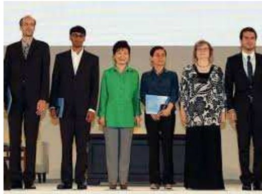
Figura 7. Maryam junto al resto de galardonados con la Medalla Fields en 2014