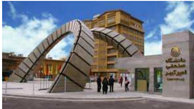
Figura 3. La Universidad Sharif, en Teherán