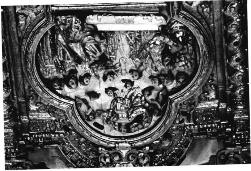
Retablo Mayor de la Iglesia Parroquial de Bormos. Remate, obra de Juan de Valencia.