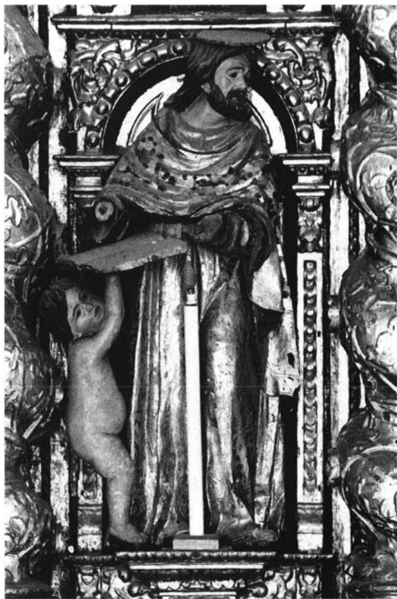
Retablo Mayor de la Iglesia Parroquial de Bornos.

Primer cuerpo. Imagen del Evangelista San Mateo, obra de Juan de Valencia.