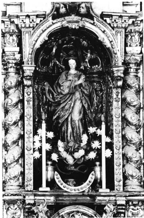
Retablo Mayor de la Iglesia Parroquial de Bornos.

Primer cuerpo. Inmaculada Concepción, atribuida a Francisco de Acosta.