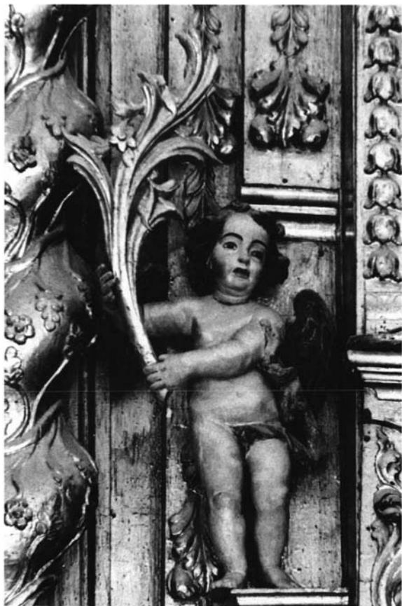
Retablo Mayor de la Iglesia Parroquial de Bornos. Segundo cuerpo. Angel, obra de Francisco de Acosta.