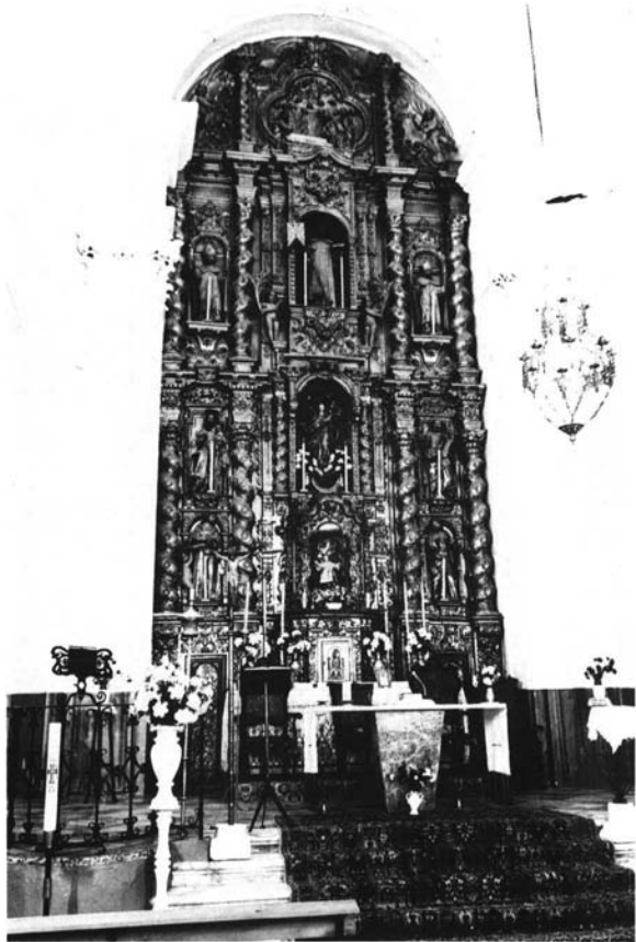
Retablo Mayor de la Iglesia Parroquial de Bornos.