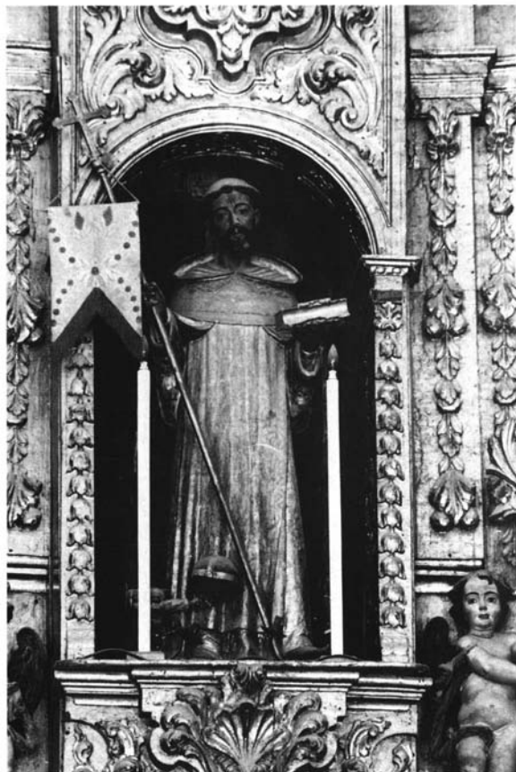
Retablo Mayor de la Iglesia Parroquial de Bornos.

Segundo cuerpo. Imagen del titular Santo Domingo de Guzmán, obra de Juan de Valencia.