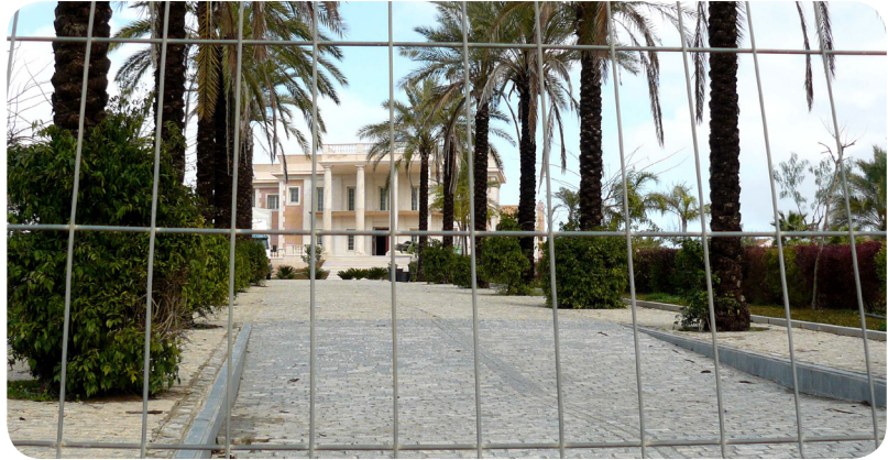
Nuevo modelo arquitectónico de los propios nativos, conllevando nuevos conceptos de “bien, riqueza, belleza”. (Salteras)