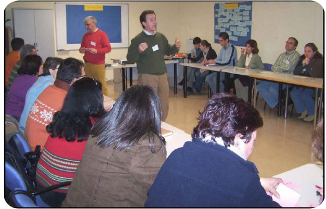
Uno de los talleres de participación ciudadana. Éste en Albolote (Granada, PrV).

representantes de los distintos colectivos locales y de los nuevos residentes, y de entrevistas grupales - la realización de talleres participativos para la puesta en común y para la construcción de visiones compartidas