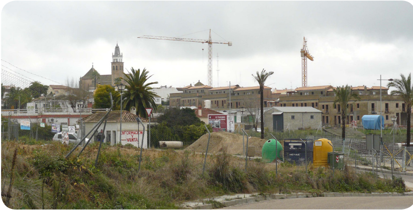
Pérdida de la propia imagen o paisaje de la silueta de pueblo tradicional (Salteras)