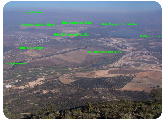
Ocupación extensiva y acelerada del territorio. Vista general desde Sierra Elvira de los amplios desarrollos urbanísticos de Atarfe y Albolote en torno al valle y pantano del río Cubillas.

señalaron primordialmente las de los siguientes tipos: