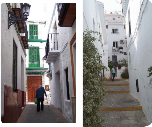
Calles de Torrox-pueblo, con su tradicional arquitectura popular característica de los pueblos andaluces de montaña.