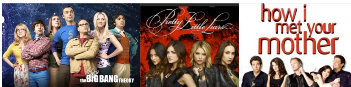
Gráfico 1: Imágenes con los protagonistas de las series preferidas por los encuestados.

La ficción televisiva es el género preferido por los encuestados en este estudio. Alrededor de un 40% elige una serie como programa preferido. La explicación que dan es que les divierte. Sin embargo, eligen series muy diversas, entre ellas hay comedias de situación, series de misterio, comedia familiar, y también otras de corte más dramático. En este apartado también se incluyen las telenovelas.