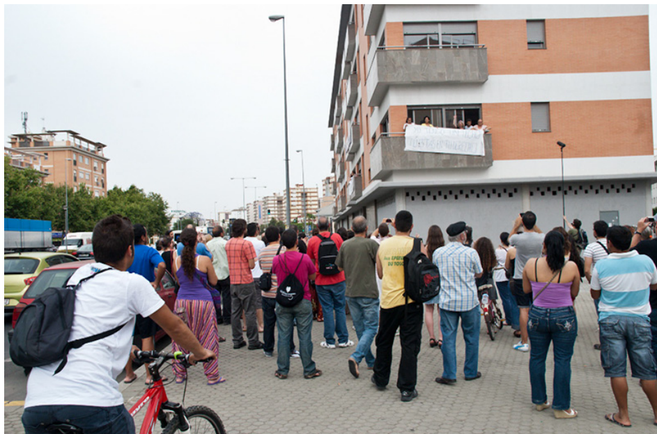
Figura 3. Ocupación de la Corrala La Utopía.