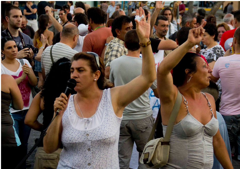
Figura 2. Manifestación por la vivienda en Sevilla (2012)

En Sevilla, la Intercomisión de Vivienda realizó un primer acto público con una convocatoria de manifestación contra los desahucios en octubre de 2011. La misma acabaría con la ocupación del Mercado Provisional de la Encarnación situado justo al lado de la plaza de “Las Setas” donde estuviera la acampada sevillana del movimiento 15M. Sin embargo esta ocupación fue desalojada de forma relativamente rápida, sin dar tiempo a hacer un uso real del espacio. Por otro lado, el movimiento en Sevilla había empezado a convocar concentraciones para parar desahucios desde julio. A partir de octubre esta actividad pasó a organizarse directamente desde la Intercomisión y/o desde las distintas comisiones de vivienda de los barrios. Resultó especialmente relevante la paralización de un desahucio el 1 de diciembre en Torreblanca, con un gran seguimiento por parte del vecindario de este popular barrio que tomó por sorpresa a los activistas más veteranos. Las acciones de este tipo se repetirían durante todo 2012 (figura 2).