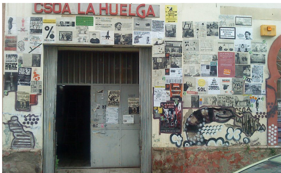
Figura 1. Fachada del CSOA La Huelga.