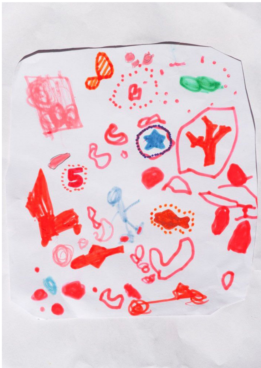
Figura 3. Dibujo niño de 7 años. ©

En estos primeros grafismos infantiles hemos encontrado paralelismos con la simbología del arte prehistórico así en el arte primevo naturalista del período