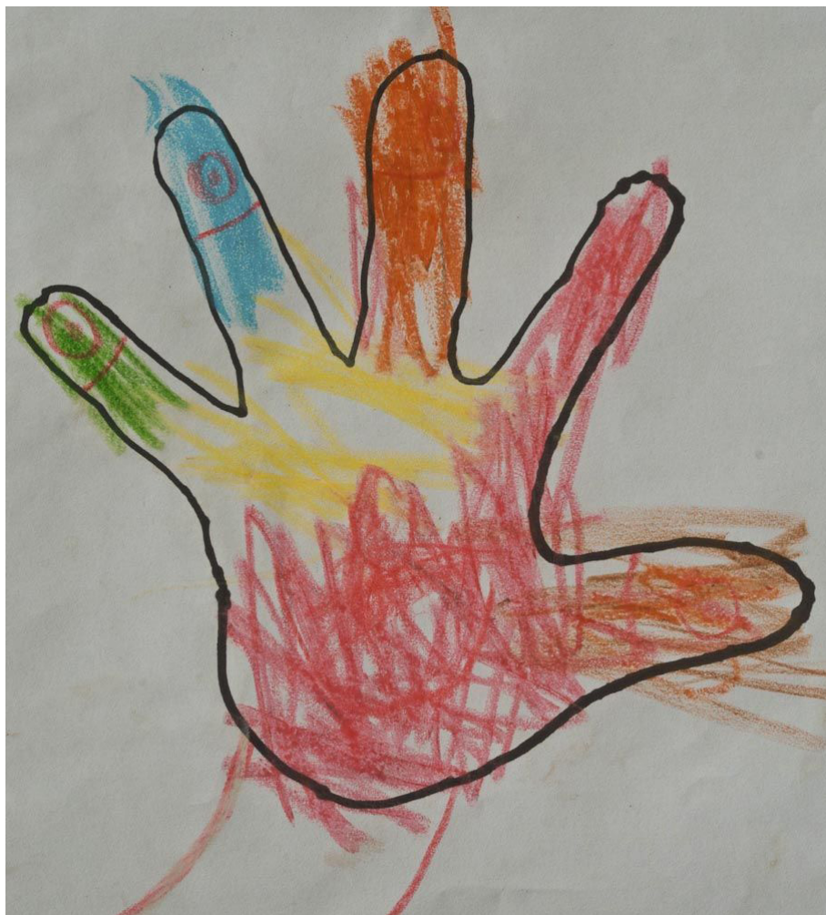
Figura 6. Palma de la mano sobre el papel contorneando la silueta. (Dibujo de un niño de 7 años). ©

S. Giedion nos dice acerca de este símbolo: “En las culturas más dispares de las cuatro partes del mundo aparecen manos provistas de significado simbólico. Lo más que tienen en común es su afinidad humana: rara vez puede apreciarse otra vinculación directa con ellas.” (1991, p.122)