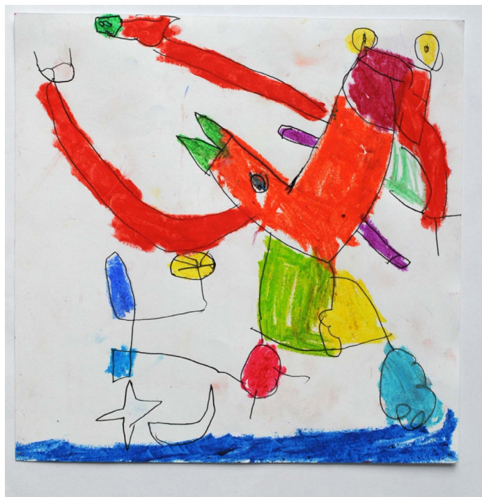
Figura 1. Dibujo niño de 7 años. ©