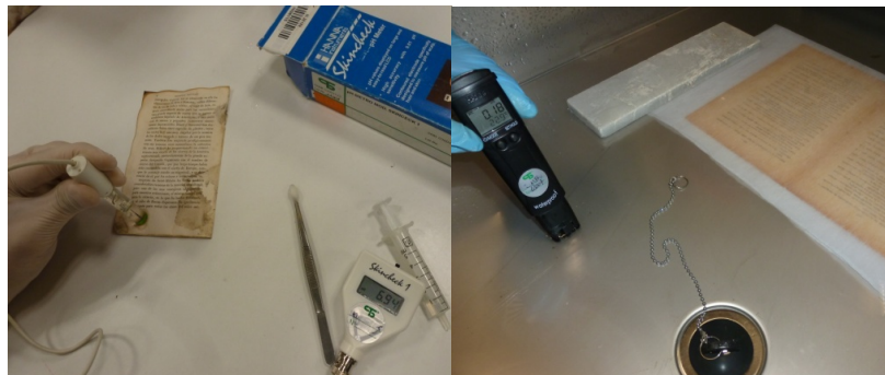
Figuras 5 y 6. Medición del pH sobre la obra intervenida y en el agua del baño con un peachímetro con medición a la gota (izquierda) y otro mediante inmersión (derecha).

intervención. Si al depositar el hisopo humedecido éste queda manchado, la prueba se considera positiva y por tanto sería necesaria la fijación antes de la intervención o el uso de otro tipo de productos.