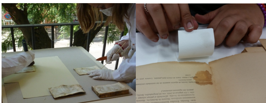
Figuras 3 y 4. A la izquierda, imagen de la manipulación y limpieza de una obra afectada por ataque fúngico y a la derecha, realización de una prueba de solubilidad de tintas.

Aunque el patrimonio bibliográfico y documental puede ser analizado en la actualidad con un amplio espectro de técnicas de análisis bastante costosas y complejas, los análisis realizados a los bienes intervenidos en el aula se centran fundamente a la medición del pH y distintas pruebas de solubilidad.