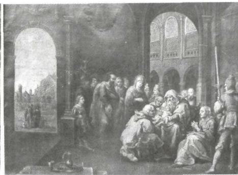
Abraham Willemsen: La Circuncisión . Alba de Tormes. Convento de Carmelitas.