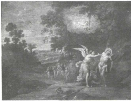
Abraham Willemsen: Martirio de San Sebastián . Alba de Tormes. Convento de Carmelitas.