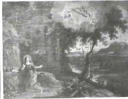
Abraham Willemsen: Magdalena penitente . Alba de Tormes. Convento de Carmelitas.