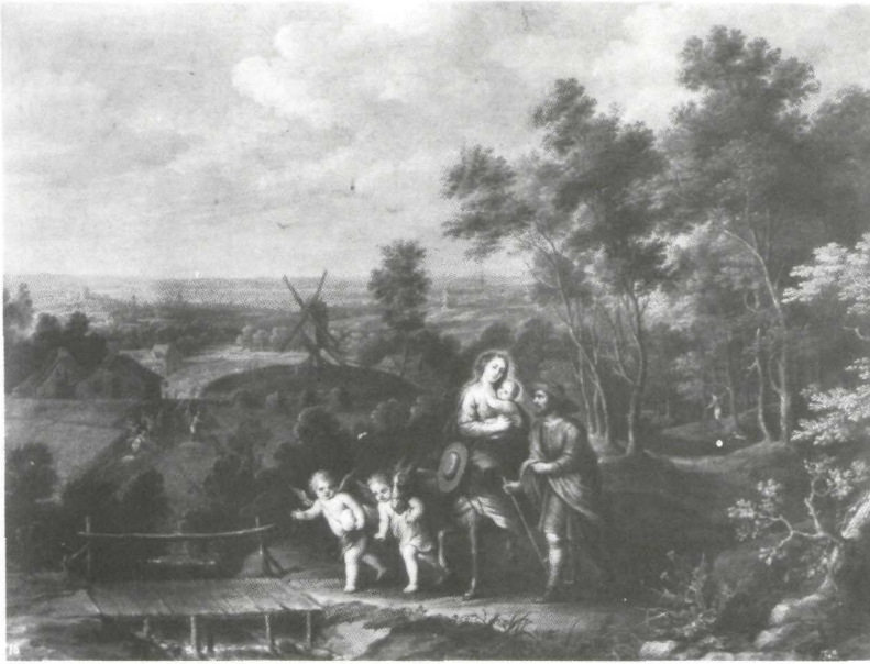
Abraham Willemsen: La huida a Egipto . Museo del Prado.