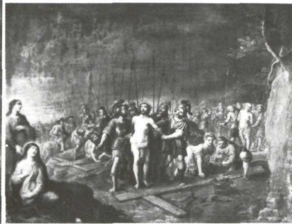
Abraham Willemsen: El Expolio . El Henar. Segovia.