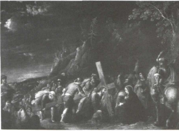
Abraham Willemsen: Camino del Calvario . Bilbao. Colección Pérez Oyanguren.