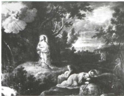
Abraham Willemsen: La Oración en el Huerto . El Henar. Segovia.