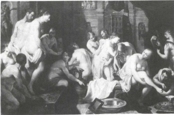
Artus Wolffordt: El baño de Diana . Hagen (Holanda). Colección particular.