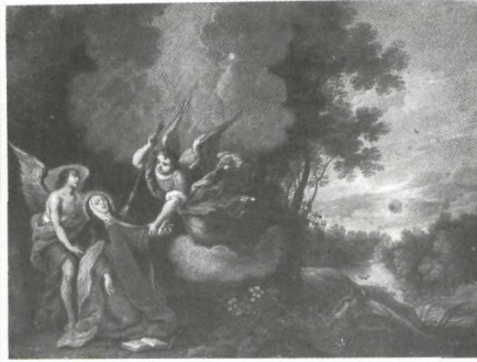
Abraham Willemsen: Transverberación de Santa Teresa . Alba de Tormes. Convento de Carmelitas.