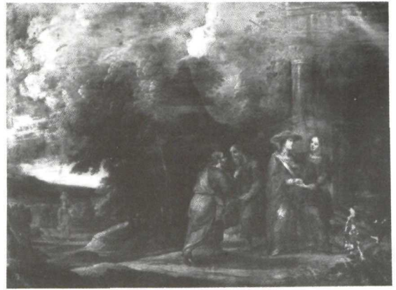
Abraham Willemsen: La Visitación . Almería. Catedral.